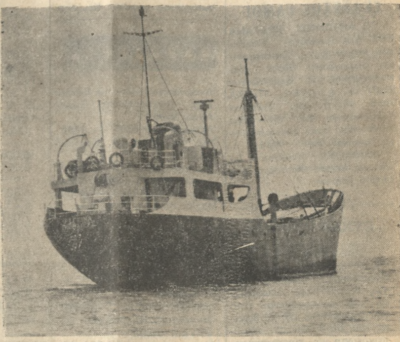
Το «ΡΕΓΓΙΝΑ» ξεκουράζεται στο Λιμικό Πέλαγος χωρίς το «πολύτιμο» φορτίο.