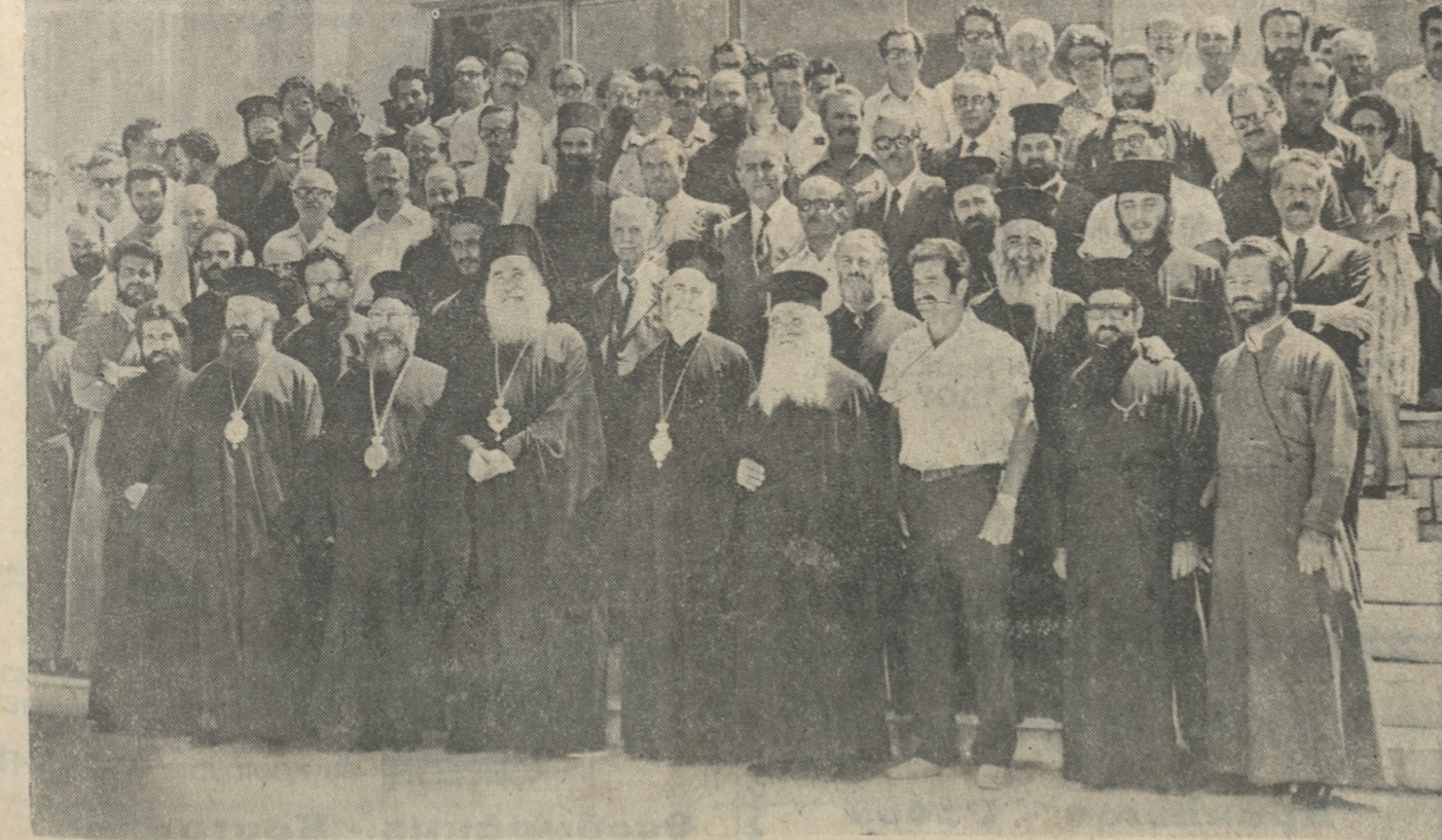
Ένα φωτογραφικό στιγμιότυπο από την ημέρα άναρξωσης του Βου Παγκρητίου Θεολογικού Συνεδρίου, οι έργασίες του όποιου λήγουν σήμερα.

Στην αίθουσα πνευματικών εκδηλώσεων του Οικονομικού Αρρένων της Έπιτοχίας Αρχιεπισκόπου Κρήτης άρχισε τις έργασίες του προχθές Κυριακή το Δεύτερο Πανορθόξ Θεολογικό Σεμινάριο που τελέει ύπό την αίγίδα της Έπιτοχίας Συνόδου Κρήτης. Σώφωνα με το πρόγραμμα το πρώτο της Κυριακής τελεσθήσεν στον Μητροπολιτικό ναό του Αγίου Μηνά θεία Λειτουργία, με έπισημο τον Σεβ. Μητροπολίτη Γερμανίας και Αρχιεπίσκοπο που έκίνησε και τον θείον λόγον, προσήλθη δε κατ' αυτήν μέλη της Έπιτοχίας Συνόδου Κρήτης, οι εκπρόσωποι των πολιτικών και στρατιωτικών άρχων Ηρακλείου και πνεύνο εκκλησιαστικά. Έπισημοί έδωσαν έπισημοί των Συνεδρών και των Αρχών της πόλεως στην Αρχιεπιστολή. Μετέβησαν δε κατόπιν στο Οικονομείο που είχαν οριστεί τόπος διεξαγωγής των εργασιών του Συνεδρίου. Στο Σεμινάριο συμμετέχουν έξι από τον Σεβ. Αρχιεπίσκοπο Κρήτης κ. Ευγένιος, του Σεβ. Μητροπολίτη Γερμανίας και Αρχιεπίσκοπος Κ. Τυροβόλου, Κυδωνίας και Απαιριών κ. Ειρηναίος, Κισσίου και Σελίνου κ. Κυρίλλου και δύο εκπρόσωποι της Εκκλησίας της Σερβίας θεολόγοι καθηγητές της Πατριαρχικής Σχολής του έπι Πατριαρχείου. Συμμετέχουν έπισης οι θεολόγοι Ιάκωβος Μόνιος άνώτερος εκπαιδευτικός, ο κ. Κωνσταντίνος Γρηγοριάδης Γεν. Έπιτοχίας Μ. Εκπαιδευτικός, ο κ. Αλέξανδρος Ποποδάκης Διότης Ορθόδοξος Ακαδημίας Κρήτης και ύπερκατόν άλλοι θεολόγοι κληρικοί και λαϊκοί. Άσφύ προσεφώνησε τους συνέδρους ο Αρχιεπίσκοπος Κρήτης, και άνακοίνωσε τας εύ