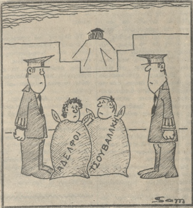
ΧΩΡΙΣ ΛΟΓΙΑ (Του Βαγγέλη Σαμαράκη)