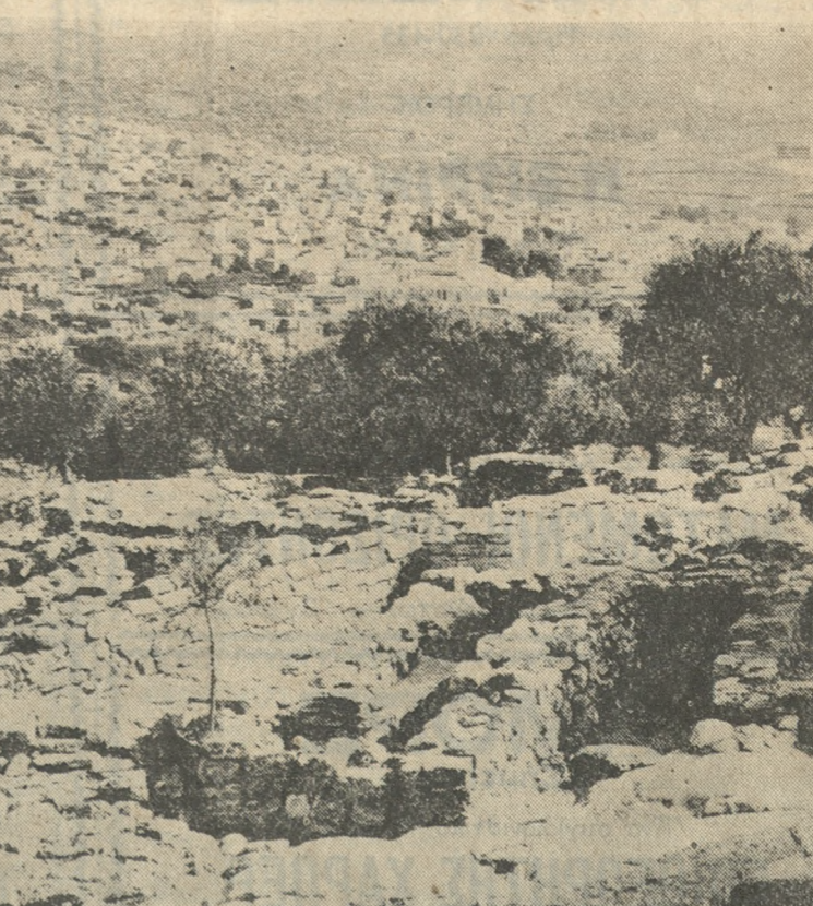
Μερική άποψη τών άνασκαφών στο έφοο Φουρνί, με φώτο τής Άνω Άρχάνες. Φωτορεπερτάζ Γ. ΒΑΖΟΣ τηλ. 288357