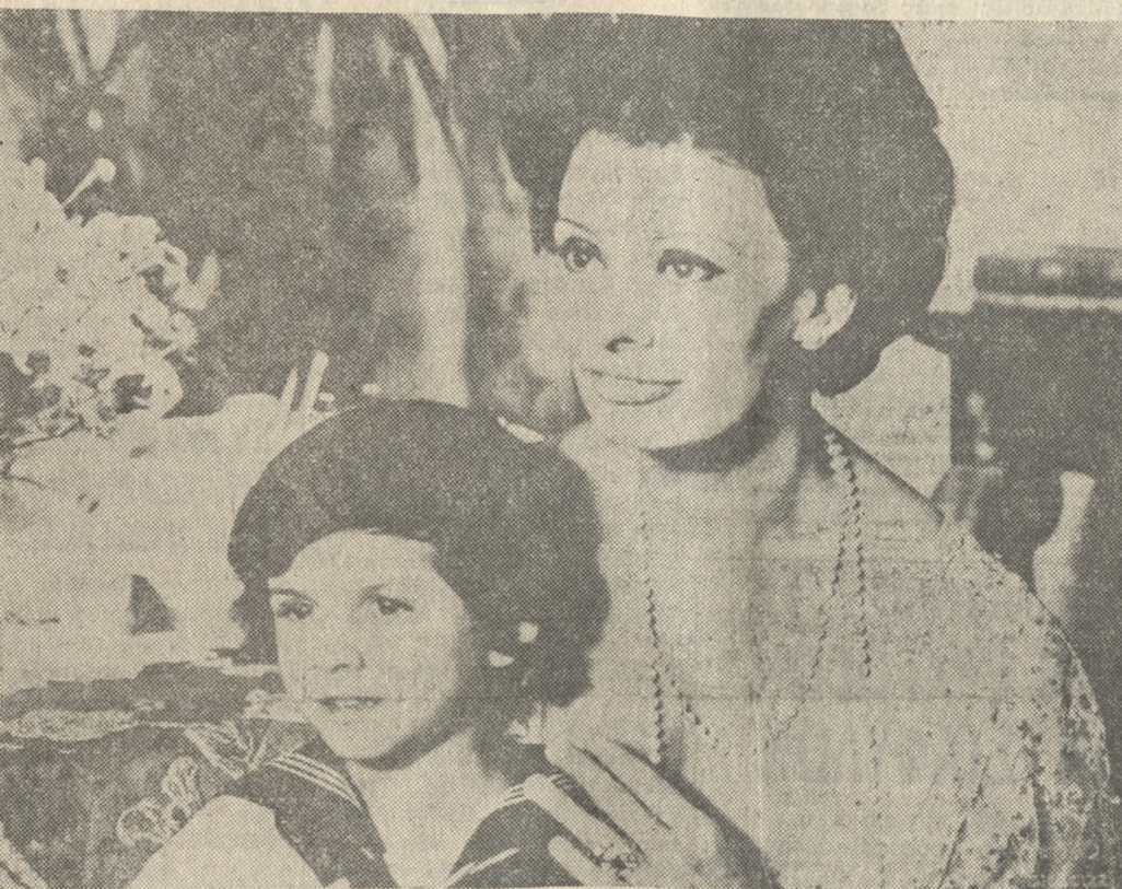
ΤΟ ΤΕΛΕΥΤΑΙΟ ΤΑΞΙΔΙ

Ο διάσημος παραγωγὸς ΚΑΡΛΟ ΠΟΝΤΙ καὶ ὁ πρωτοπόρος σκηνοθέτης τοῦ Νεο- ρεαλισμοῦ ΒΙΤΤΟΡΙΟ ΝΤΕ ΣΙΚΑ παρουσιάζουν τοὺς μοναδικούς: ΣΟΦΙΑ ΛΟ- ΡΕΝ — ΡΙΤΣΑΡΝΤ ΜΠΑΡΝΤΟΝ, στὸ ὑπέροχο Ρομάντο «ΤΟ ΤΕΛΕΥΤΑΙΟ ΤΑΞΙΔΙ». Ἡ ταινία προβάλλεται στὸν Κινηματογράφο «ΗΡΟΔΟΤΟ»