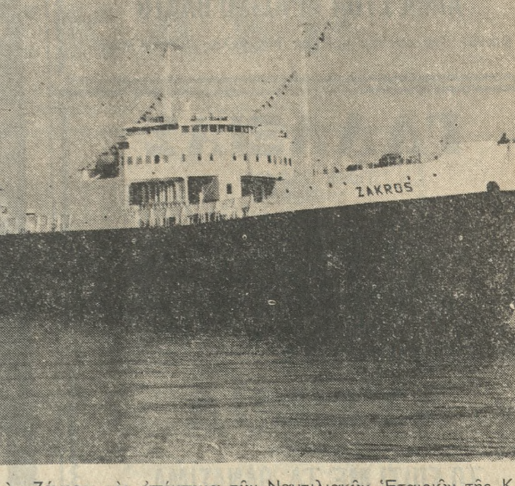
Το 'Οχηματοαγωγό «Ζάκρος» νέο άπόκτημα των Ναυτιλιακών Έταιριών της Κρή-της, έκαμε χέος το πρώτο ταξείδι στο 'Ηράκλειο. Πρέκειται για ένα τεράστιο σκάφος που θα έξυπηρετήσει άποτελεσματικά τις άνάγκες της Κρήτης σε διακι-νηση φορητών κυρίως, αλλά και έπιδατικών οχημάτων ΣΤΗ. 281396