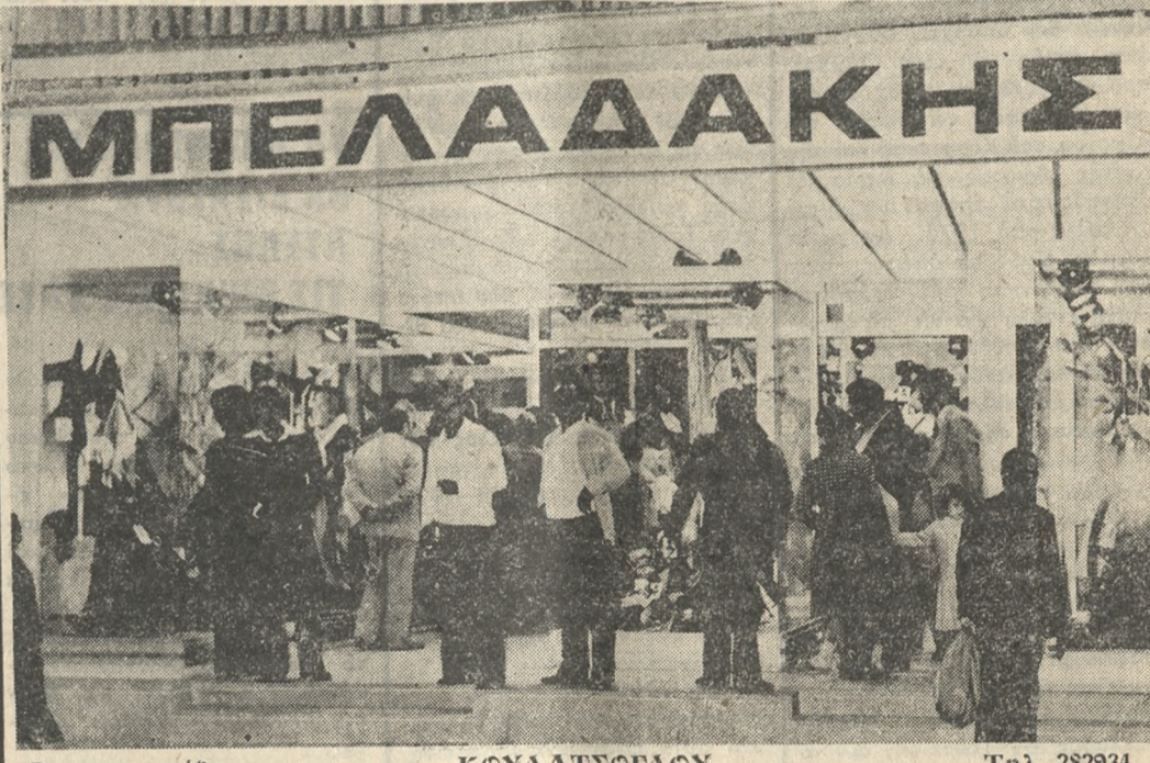
Φωτορεπορτάζ ΚΟΥΛΑΤΣΟΓΛΟΥ Τηλ. 282934

ΕΥΚΑΙΡΙΑ!! Με 6500 δραχ. τό τετραγωνικό μπορείτε τώρα να άποκτήσετε κι έσείς ένα ήμιτελές ήμιόπογοιο διαμέρισμα. Πληροφορίες: τηλέφωνα: 284181, 223037, 231731