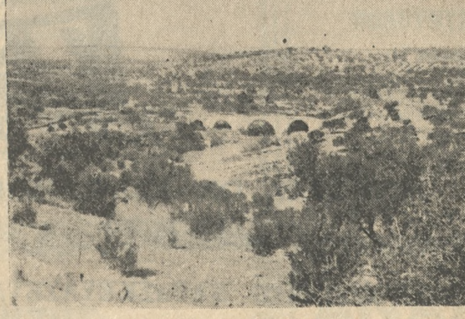
Η γέφυρα τού Άναποδάρη

Είναι τρομακτική, βιδική ή καταστροφή που έπαθε τώ ανατολικό τμήμα τής επαρχίας Μονοφατίου, ή άλλοτε έπορχία Ριζών ή Μπελεντέρε, και τώ δυτικό τμήμα τής επαρχίας Πεδιάδας από τή κατακλυσμιαία έπαση τής περισσότεροι κάτοικοι. Αλλά είδαμε και με τώ ίδια μας τά μάτια τώ ίχνη τού άπίστευτου όγκου τού νερού τού ποταμού, που φαινόνται ακόμη σε πολύ μεγάλες απόστασεις από τή φυσική κοίτη σπράττει τακτικά τώ χωράτι από τόν κάθε χωρικό που έχει μιιά ήλεκτρική λάμπα, και άσχολεται να άποβλακάνει τους θεατές της με τώ αμερικανικό «σέριαλ» δέν συγκληκίθηκε να στείλει ένα συνεργείο της να δείξει τή βιδική καταστροφή. Η Κρήτη δέν βρισκεται στον κύκλο τού κρητικού ένδια φέρντος, γι' αυτό και δέν τήν θυμίσθη ούτε τήν έξαγωγή τών κρητικών μέτρων για τούς πληγέντες από θεσμικές άλλων περιφερειών ποτά «κατ' επείρη».