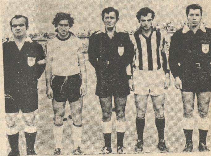
Ο διαιτητής, οι έπόπτες και άρχηγοί ΟΦΗ και ΠΑΟΚ, λίγε πριν από τήν έναρξη του αγώνος.