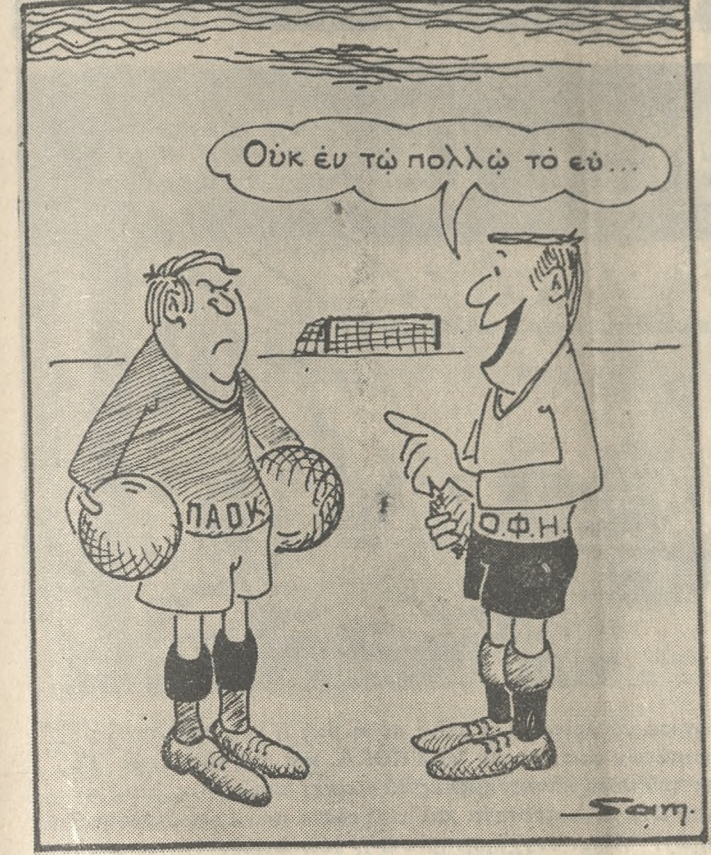
(Τού ΒΑΓΓΕΛΗ ΣΑΜΑΡΑΚΗ)