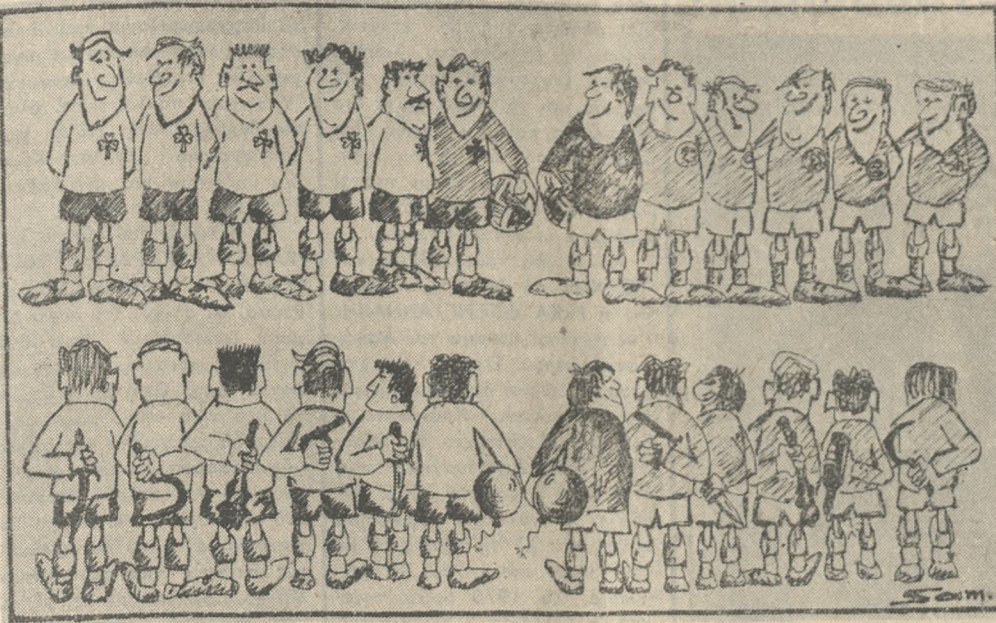
...«κατέβηκαν» για να δολοφονήσουν το ποδοσφαιρο...