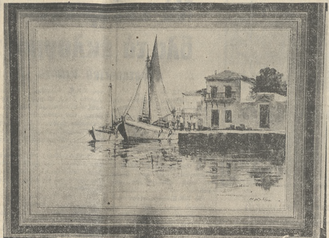
Τὴν ἐρχόμενη Δευτέρα 17 Ὀκτωβρίου θὰ γίνου στὴν Γκαλερί Κ. Σταυρακάκη τὰ ἑκατὰ ἑκθεσιῶν ἔργων ζωγραφικῆς καὶ χαρακτικῆς τοῦ γνωστοῦ ζωγράφου καὶ χαρακτικῆ Κ. Γραμματόπουλου. Ἡ ἐκδήλωση τελεῖ ὑπὸ τὴν αἰγίδα τοῦ Δημάρχου Ἡρακλείου κ. Μανώλη Καρέλλη καὶ θὰ διαρκήσῃ μέχρι τῆς 30 Ὀκτωβρίου. Στὴ φωτογραφία μας ἓνα ἔργο τοῦ κ. Γραμματόπουλου.

Πέμπτη 13 Ὀκτωβρίου '77 12.30 Γενικὲς γνώσεις 2.00—3.15 Κάθε μεσημέρι 5.40 Γενικὲς γνώσεις 6.05 Μία φορὰ κι ἓνα καιρὸ 6.35 Ὁ κόσμος πού ζοῦμε 7.00 Εἰδήσεις 7.15 Ἐρευνα 7.50 Λοῦσα Πάρκ 9.00 Εἰδήσεις 9.30 Τὸ ἑλληνικὸ δῆγημα 10.30 Παρόδωρο στὸν κόσμο 11.15 Ἐλαφρὰ ὀρχήστρα 12.00 Εἰδήσεις ΥΠΕΛΔ 1.25—2.45 Μεσημεριὸ πρόγραμμα 6.00 Τηλεσημερίαι 6.15 Χθὲς, σήμερα, αὔριο 6.30 Ντοκιμανταῖρ 6.45 Οἱ ρίζες τῆς φυλλῆς μας 7.15 Ντοκιμανταῖρ 7.45 Πτήση στὰ 10.000 μέτρα 8.00 Μάχη 9.00 Ἡ γειτονία μας 9.30 Τηλεσημερίαι 10.00 Ὁ ἅγιος 10.45 Μορφὲς τῆς τζαζ 11.00 Πλούσιος καὶ φτωχὸς 12.00 Τηλεσημερίαι