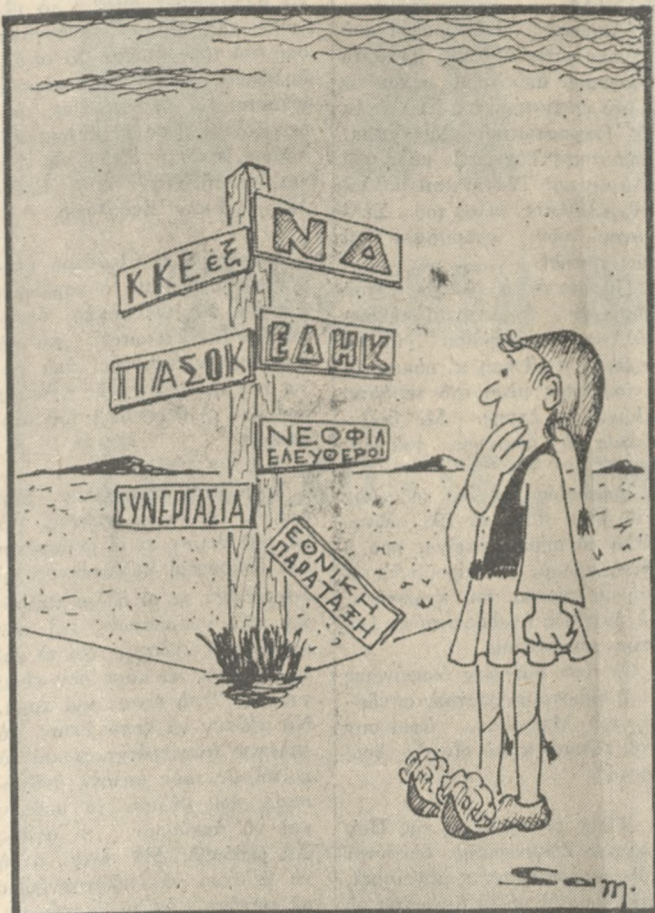
Χαρίς λόγια (ΤΟΥ ΒΑΓΓΕΛΗ ΣΑΜΑΡΑΚΗ)