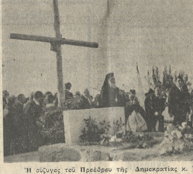
Η σύζυγος του Προέδρου της Δημοκρατίας κ. Ίωάννα Τσάτσου έναποθέτει λουλούδια πάνω στον τάφο του Νίκου Καζαντζάκη.

ΕΦΕΤΟΣ το βραβείο δόθηκε στον Χανιώτη λογοτέχνη κ.