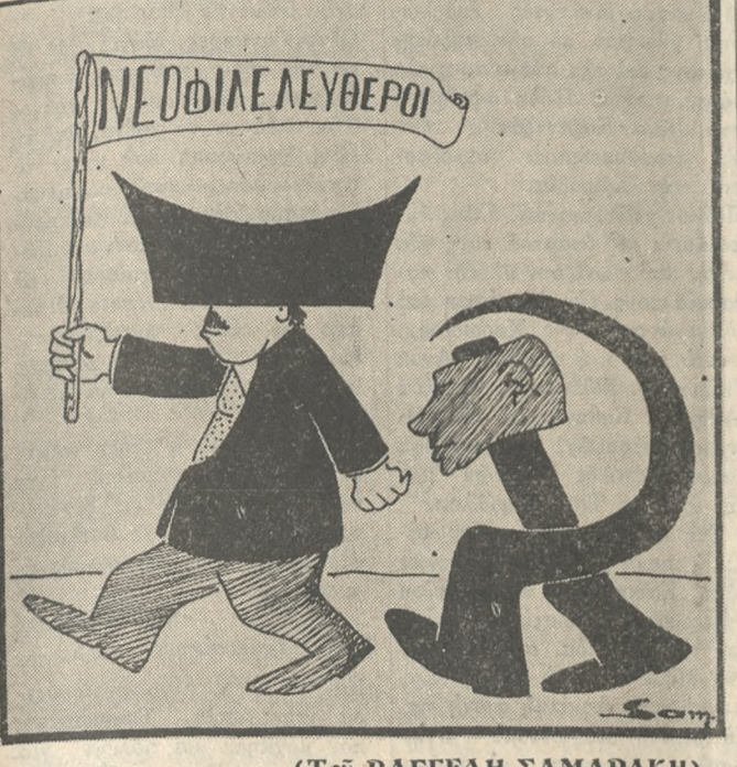
(Τού ΒΑΓΓΕΛΗ ΣΑΜΑΡΑΚΗ)