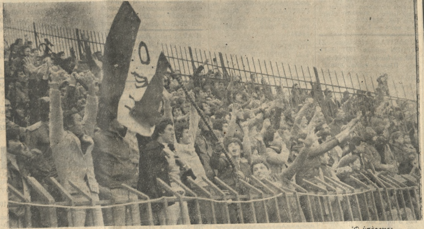
Ο ύπεροχος λαός του Ο.Φ.Η. Οι πιστοί και άφρασιωμένοι έπαδοί του 'Ηρακλειώτικου συγκρητήματος εί έποεί στάθηκαν και τήν Κυριακή στό ύψος των περιστάσεων.