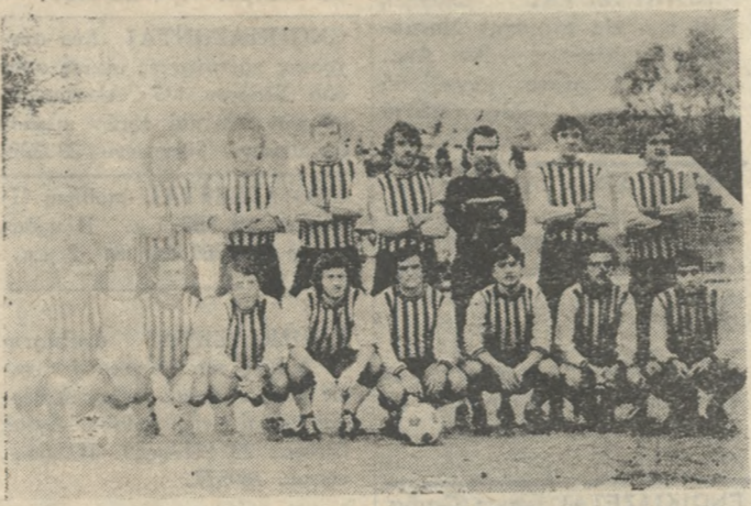
Τακτικοί και αναπληρωματικοί ποδοσφαιριστές του Εργοτέλους σε ένα στιγμιότυπο που ελήφθη λίγο πριν από την έναρξη του προχθεσινού αγώνος προς τον Ορφέα.