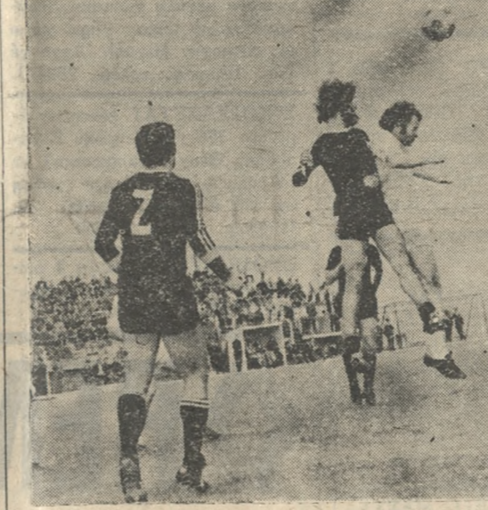
ΣΕ πείσμα αυτόν που αγαπούν το Ηρακλειώτικο ποδόσφαιρο και θέλουν να «εβρουν» τον Ηρόδοτο, με το να του τιμωρήσουν 6 ποδοσφαιριστές του, ή ομάδα της Άλι κερρασσού, ξεπέρασε άνδρινα την περιπέτεια αυτή.

Δέν τον λύγισαν οί τιμωρίες ΔΟΚΑΡΙ Ο ΗΛΥΣΙΑΚΟΣ