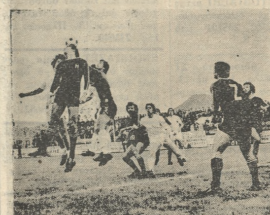
Φάσεις από τον αγώνα Ηρόδοτου - Ηλυσιακού. Η υπερχη της ομάδας της Άλι κερρασσού είναι φανερή.

Δέν τον λύγισαν οί τιμωρίες ΔΟΚΑΡΙ Ο ΗΛΥΣΙΑΚΟΣ