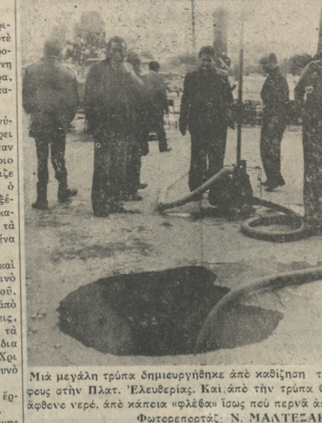
Μιά μεγάλη τρύπα δημιουργήθηκε από καθίζηση του έδάφους στην Πλατ. 'Ελευθερίας. Καί από την τρύπα έθαίνε άφερον νερέ, από κάποια 'φλέβα' ίσως που περνά από έκεί

παγάνδας και διαφωτιστές του 'Αρχηγίου Στρατού κλπ. 'Ενώ οδεμία προσφυγή έγένετο ύπό του κ. 'Υπουργού δ' άλλους άποστατεψθέντες νομμόρφους άξιωματικούς όπως π.χ. διά τους ταξ. Βουλουτιάνη και Συναρχών Μαρωνιάκη, οι όποιοι ύπηρεση στρατούσες στην δία τον θασανίον. 'Ο 'Αθνας της 17. 12. 1977 'Ο 'Επερωτών Κ. ΜΠΑΝΤΟΥΒΑΣ Βουλευτής 'Ηρακλείου ΠΡΟΣ ΤΟΝ ΥΠΟΥΡΓΟ ΕΞΩΤΕΡΙΚΩΝ 'Από τον βουλευτή κ. Κ. Μπαντουβά κατατέθηκε για τον ύπουργό Εξωτερικών ή παρακάτω έπερωτηση: 'Επερωτήσθη διότι: 1) 'Ανεγέρθη άδιαμαρτήρητα όπος το Τουρκικό Προέβειον 'Αθναίον, ποικεμένω να χορηγήση Βίζα σε 'Ελληνες διά την Τουρκία ζητεί έκλογικό διδωλιόριον και ταυτότητα παραλλήλα με το διαβατήριον. 'Όπως είναι γνωστό κανένα άλλο έθνος Προέβειον δέν ζητεί παρόμοια στοιχεία τα όποια άφορούν εις σχέση 'Ελλνος πολίτου προς το Κράτος και δέν είναι έκδικειτικά έλέγχο από ζένη Χώρα. Τουτό άποτελεί μία μορφή ένωσης έπειθεσίας σε καθαρές έθνομικώς μας θέματα. 2) Δέν έγίνετο κανένα διάγραμμα στην Τουρκική Κυβέρνηση διό άπό γεγονός, ότι άνδρες της Τουρκικής άσφαλείας έλέγχουν θρασυτάτα και μετά διαυτίτους τους όμονετες, οι όποιοι άπευθίνονται στις 'Ελληνικές Προέβειες άρχες διά ύποθέσεις τους. 'Εν 'Αθνας 19)12)77 'Ο 'Επερωτών Βουλευτής ΚΩΣΤΑΣ Ι. ΜΠΑΝΤΟΥΒΑΣ Βουλευτής 'Ηρακλείου