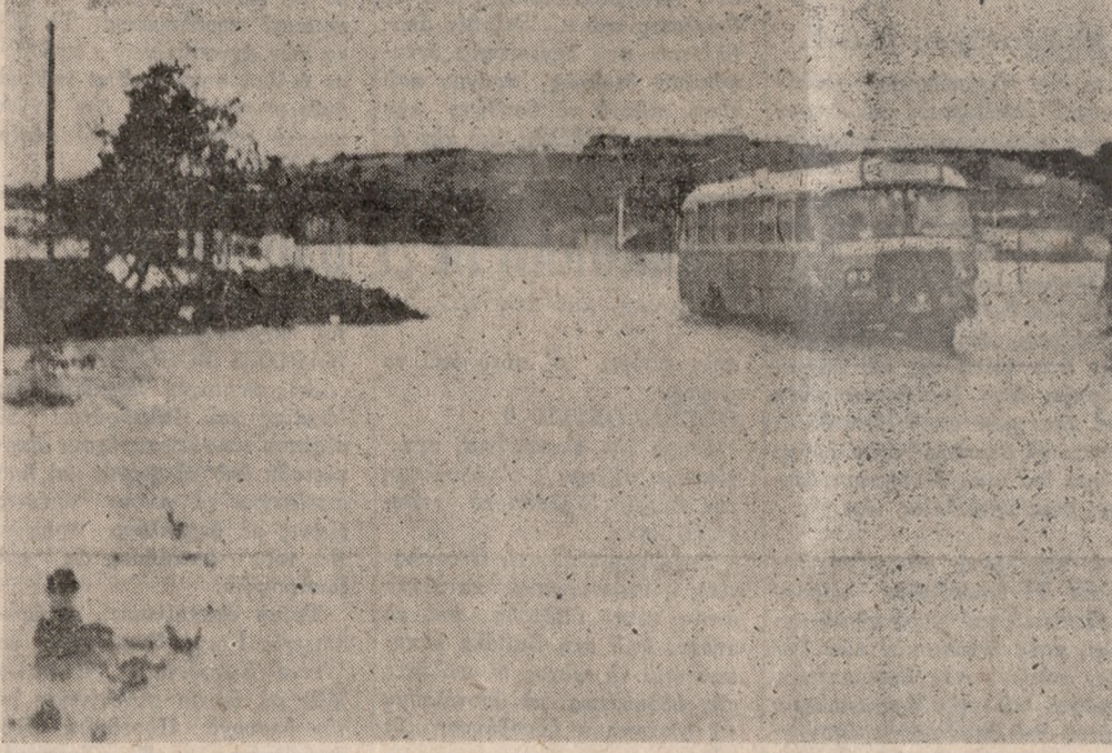
Τρία χαρακτηριστικά στιγμιότυπα από τις καταρρακτώδεις βροχές που έπεσαν τήν Κυριακή στο Ηράκλειο, με αποτέλεσμα να πλημμυρίσουν πολλοί χείμαρροι και να αποκλειστούν οικογένειες σε άγροικίες. Εύτυχώς δεν υπάρχουν θύματα.