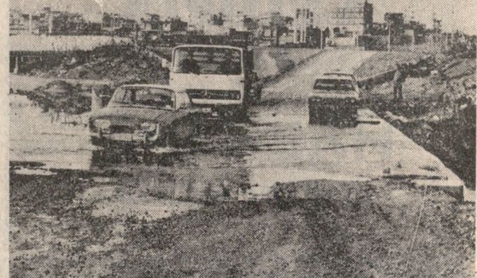
Δύσκολα μπορούν να περσούν τα ατεκνιχτα από την έφυρα που ένωνει το λιμάνι με την Άνακλινη Κρήτη. Εξέαια για τους περσός ή διάσφαση είναι άδύνατη. Και να σκεφθεί κανείς ότι ύπάρχει μελετή που δεν έτελειται γιατι το Κράτος δεν πληρώνει τα χρέματα τών άκαλλετρίσεων.