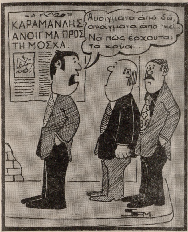
(Του ΒΑΓΓΕΛΗ ΣΑΜΑΡΑΚΗ)