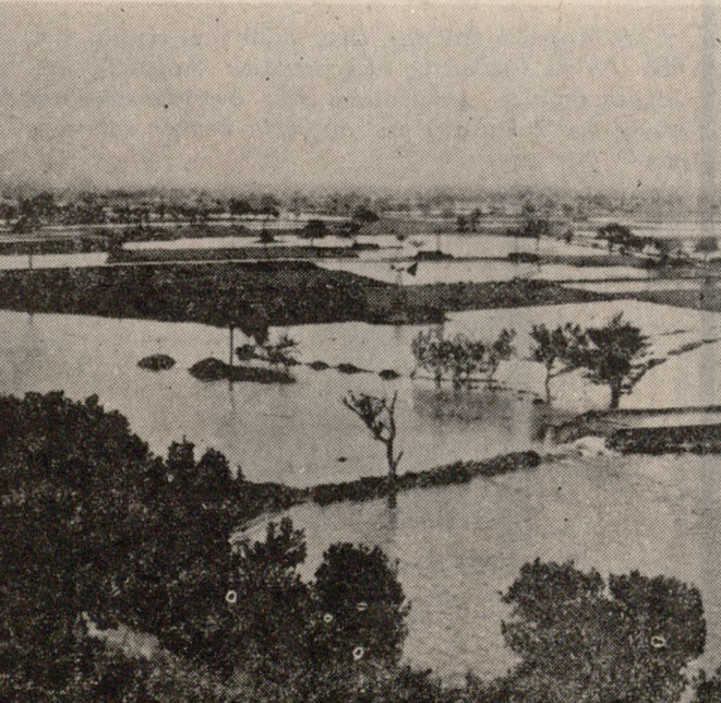
Συνεπεία τών τελευταίων έβραχών πλημμύρισε στην κυριόσεια το Όροπέδιο Λασιθίου. Άψευδής μάτρυρας ή παραπάνω φωτογραφία.