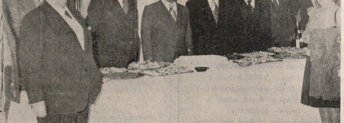
Παραίση τόν Νομάρχου 'Ηρακλείου κ. Καραγκουνίδη κόπικε προχθές τόν βράδυ ή πίττα τόν 'Εμπορικού και Βιομηχανικού 'Επιμελητηρίου 'Ηρακλείου. Προηγούμενος έγινε σύσκεψη υπό την προεδρία τόν κ. Νομάρχου, κατά την διάρκεια της όποιας εξέτάστηκαν τοπικά θέματα.