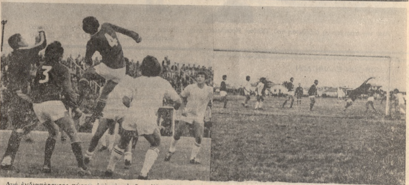
Δύο ένδιαφέρουσες φάσεις από τόν άγώνα Ήροδότου— Α.Ο. Πατράι, για τό πρωτάθλημα Β' Έθνικής Κατηγορίας. Δεξιά επιτυγχάνεται τό δεύτερο γκόλ τής ομάδας τής Άλικαρνασσού.

τήν έπίθεση και οι παίκτες έπαιξαν πολύ καλά τό ένα-ένα. ΣΤΟ διάστημα αυτό ό Άνταγόρας άμυνόταν άπεγνωσμένα για να άποφύγει τήν συντριβή. ΣΤΗΝ επανάληψη ή απόδοση τών παικτών του Έργοτέλους «έπεσε» γιατί είχαν ένκενυρισθή από τίς άποφάσεις του διαιτητού.