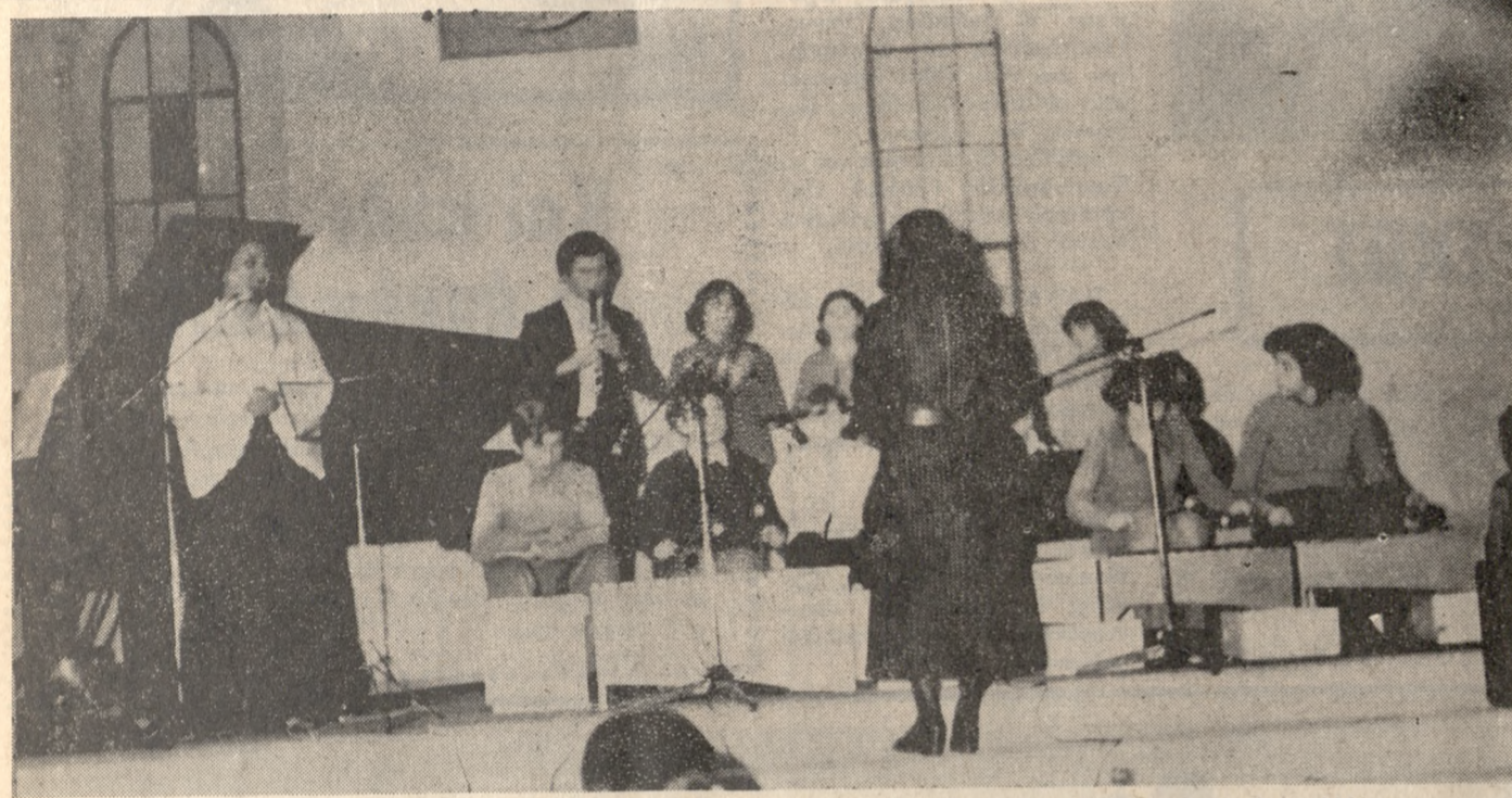
Από την προχθεσινή εκδήλωση του Ώδειου Ήρακλειού στην αίθουσα της Βασιλικής του Αγίου Μάρκου.