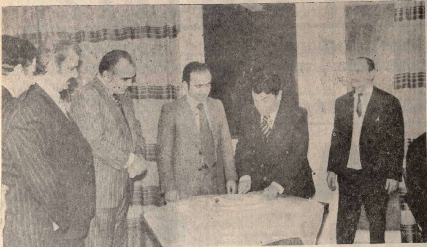
Ο Νομάρχης Ήρακλειού κ. Καραγκούνδης κόβει την πίττα των μελών της Λέσχης Δημοσίων και Δημοτικών Ύπαλλήλων, εύχόμενος υγεία και χαρά για το Νέο Έτος 1978.