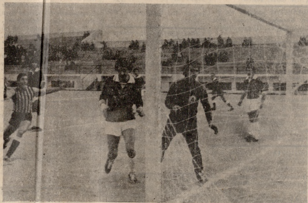
Μιά φάση από τόν προχθεσινό άγώνα Έργοτέλους— Άνταγόρα (2-1). Είναι ή άρχή του δεύτερου γκόλ τών κιτρινωμάρων.

ΔΥΟ «χτυπητά» λάθη του διαιτητού κ. Κορυή λίγο έλειπε να «κάνεινάξει» τόν άγώνα Έργοτέλους— Άνταγόρα (2-1) για τό πρωτάθλημα Έθνικής Έρασιτεχνικής Κατηγορίας. ΕΝΩ τό σκόρ ήταν 2-0 υπέρ τών γηπεδοφύλων ό διαιτητής άκύρωσε κανονικό γκόλ του Έργοτέλους και καταχώρησε άντικανονικό του Ήροδότου. ΕΤΣΙ άντι να γίνει τό σκόρ 3-0, έγινε 2-1, με άποτέλεσμα να είναι δύσκολη ή εξέλιξη του άγώνος. ΑΣ δοίμε, όμως, με τήν σειρά πώς εξελίχθηκε τό μάτς.