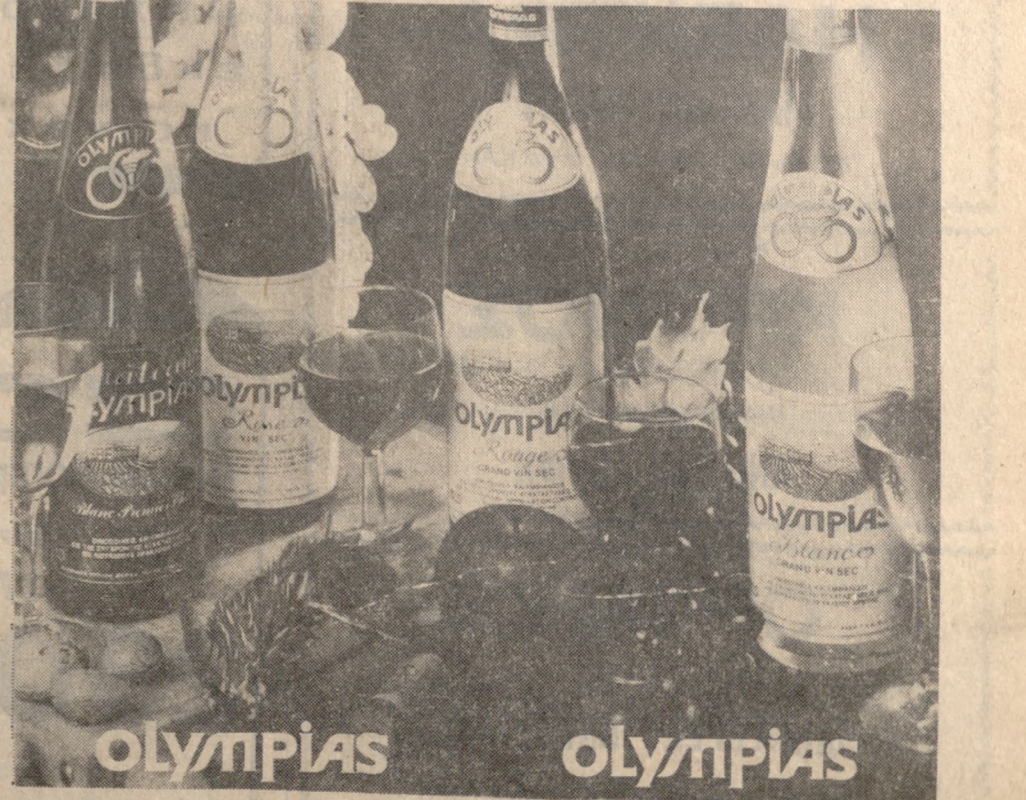
Πρατήριον 'Ηρακλείου Θεο) νίκης 7 τηλ. 282-949