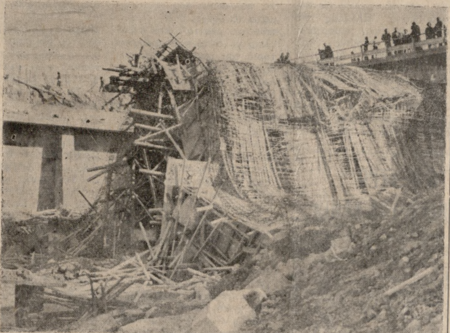
Σίδερα, μπετόν και καλούπι μετά την πτώση.