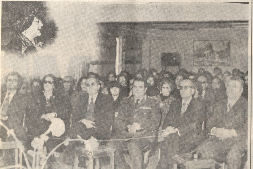
Ἐνα στιγμιότυπο ἀπὸ τὴν ἐορτὴ τῆς κοπῆς τῆς πίττας τοῦ Συνδέσμου Σχολικῶν Σπουδαστικῶν Ὑποτροφίῶν.