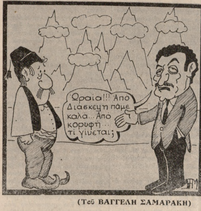
(Του ΒΑΓΓΕΛΗ ΣΑΜΑΡΑΚΗ)