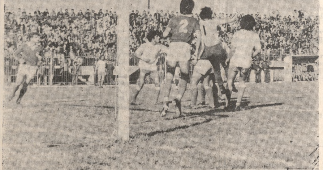
Συναγερμός στην έστια του Παναρκαδικού, ο τερματοφύλακας του όποιου άπεκρούσε με γρηθείς, ύστερα από σέντρα του Μαργέτα, ύπερταχόμενος άπό τους συμπαίκτες του.