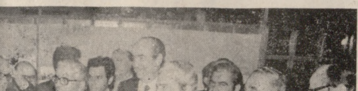
Ο ύφυπουργός Παιδείας κ. Χ. Καρατζάς μετρώσά στή Μακίεττα τών προκατασκευασμένων συγκροτημάτων για τήν στέγαση του Πανεπιστημίου Κρήτης στο χώρο του Βενιζελείου.

ΤΟ μεσημέρι δόθηκε γεύμα πρς τμήν του κ. Υφυπουργού στο ξενοδοχείο «Άτλαντίδα».