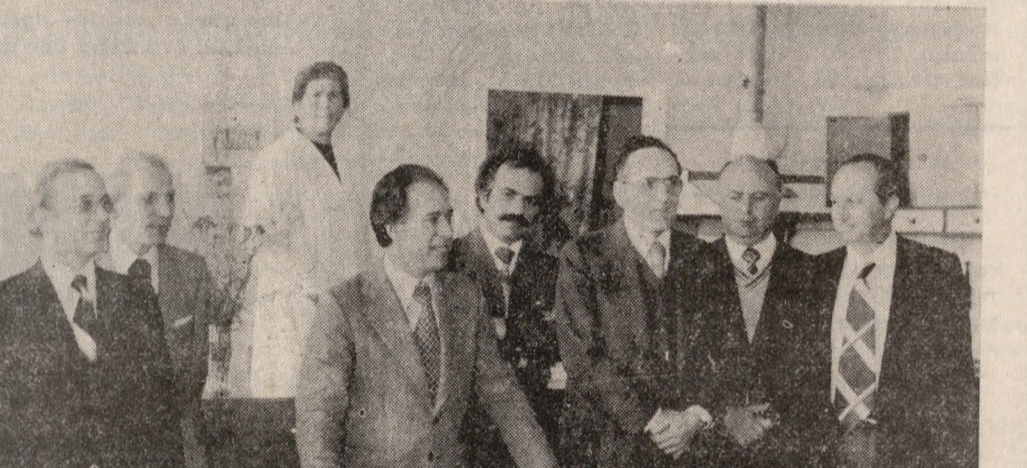
Τὸ Έργαστήριον τής ΧΕΝΝΙΓΚΕΡ στο 'Ηράκλειο έκθεσε τήν πίττα του. Παρευρέθησαν ό Γεν. Διευθυντής τής έταιρείας, στελέχη και τὸ προσωπικόν 'Ηρακλείου.