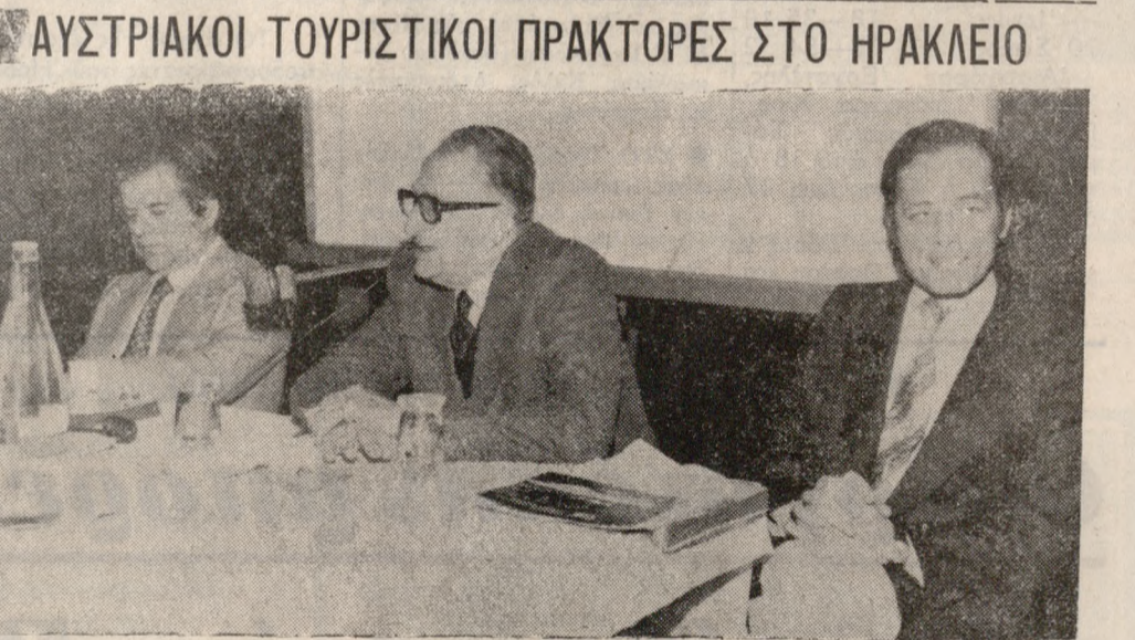
Έκατόν εξήντα Αυστριακοί Τουριστικοί Πράκτορες και Δημοσιογράφοι καλεσμένοι τού Τουριστικού Γραφείου «ITAS» και με τήν συνεργασία τού EOT ήλθαν στο 'Ηράκλειο και παρακολούθησαν προχθές στο «KRETA MARIS» Ντεκυμανταίρ και διάλεξη για τόν Κρητικό Τουρισμό. Στις φωτογραφίες, στιμμάτωπα από τήν εκδήλωση. Φωτορεπορτάς: Β. ΔΡΟΣΟΣ τηλ. 221830