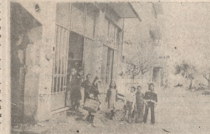
Όχι μόνο αλλη, άλλα ούτε πεσοδρόμιο δέν ύπάρχει στο παράγκωμα αυτό τού 26ου Δημοτικού Σχολείου.