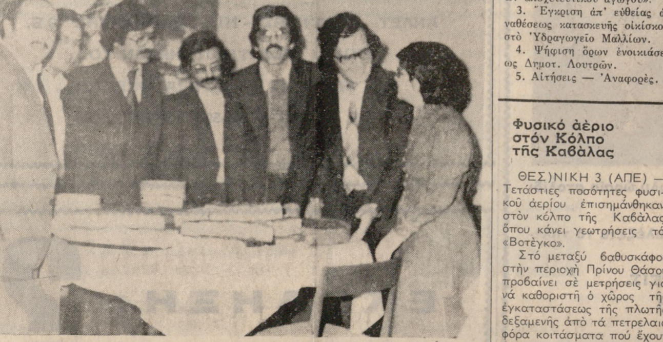
'Ο Σύλλογος Οικονομολόγων 'Ανατολικής Κρήτης έκοψε προχθές την πίττα στο Ξενοδοχείο «ΞΕΝΙΑ». Στη φωτογραφία μας τό Διοικητικό Συμβούλιο του Συλλόγου μεράζει την πίττα.