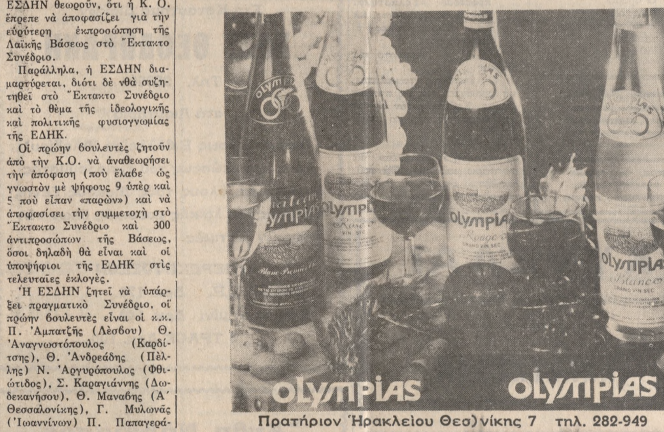
Πρατήριο Ηρακλείου Θεοφάνους 7 τηλ. 282-949