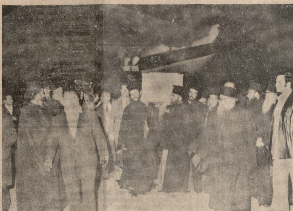
Χιλιάδες άνθρωποι από όλα τα στρώματα του λαού, και απ' όλη την Κρήτη, κατακλύζουν από χθές, τον Ναό του Αγίου Μηνά, για να προσκυνήσουν το σκηνώμα του νεκρού Αρχιεπισκόπου, με έντονα χαραγμένη τη δίψη στα πρόσωπά τους.

Η ΜΕΤΑΚΟΜΙΔΗ του σκηνώματος έγινε στο 'Ηράκλειο με την Οικουμενική γέση θράση στις 6.40 από το Λονδίνο, μέσω 'Αθηνών. Το συνόδευαν