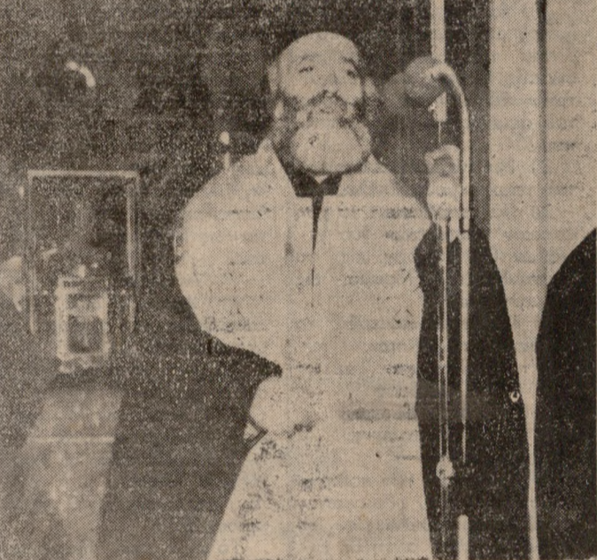
Ο ΤΟΠΟΤΗΡΗΤΗΣ ΜΗΤΡΟΠΟΛΙΤΗΣ κ. ΔΗΜΗΤΡΙΟΣ

Η ΚΗΔΕΙΑ του Μακαριστού Αρχιεπισκόπου Κρήτης κυρού Εγγενίου θα γίνει το Σάββατο το πρωί στις 11 από το Μητροπολιτικό Ναό του Αγίου Μηνά. Την απόφαση αυτή έλασε η Γενική Επαρχιακή Σύνοδος της Εκκλησίας Κρήτης, η οποία συνεδρίασε χθές το βράδυ υπό την προεδρία του Τοποτηρητού Μητροπολίτου Πέτρας κ. Δημητρίου. Επίσης η Σύνοδος πήρε τις ακόλουθες αποφάσεις: