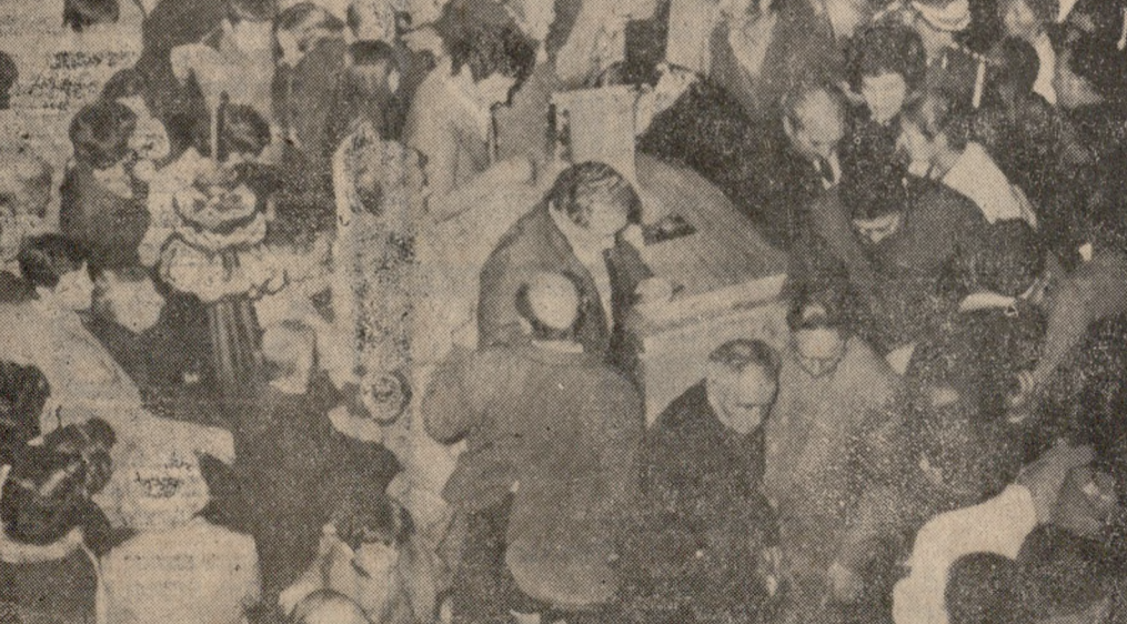
Χιλιάδες άνθρωποι από όλα τα στρώματα του λαού, και απ' όλη την Κρήτη, κατακλύζουν από χθές, τον Ναό του Αγίου Μηνά, για να προσκυνήσουν το σκηνώμα του νεκρού Αρχιεπισκόπου, με έντονα χαραγμένη τη δίψη στα πρόσωπά τους.

ΣΗΜΕΙΩΣΙΣ: Τά κατά την κηδείαν περιέχονται έν καταρτησθέντι έκκλησιαστικώ προγράμματι.