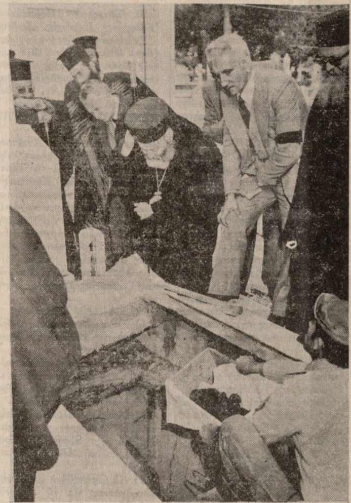
Πραγματοποιήθηκε χθές η έκταξη του πρώην Μητροπολίτου Κρήτης Βασιλείου. Στη φωτογραφία μας ἕνα στιγμιότυπο.

ΜΕΤΑ την νεκρώσιμη ακολουθία τὸ σκήνωμα του Μακαριστού Αρχιεπισκόπου θα τοποθετηθῆ σὲ κιλβίθανα