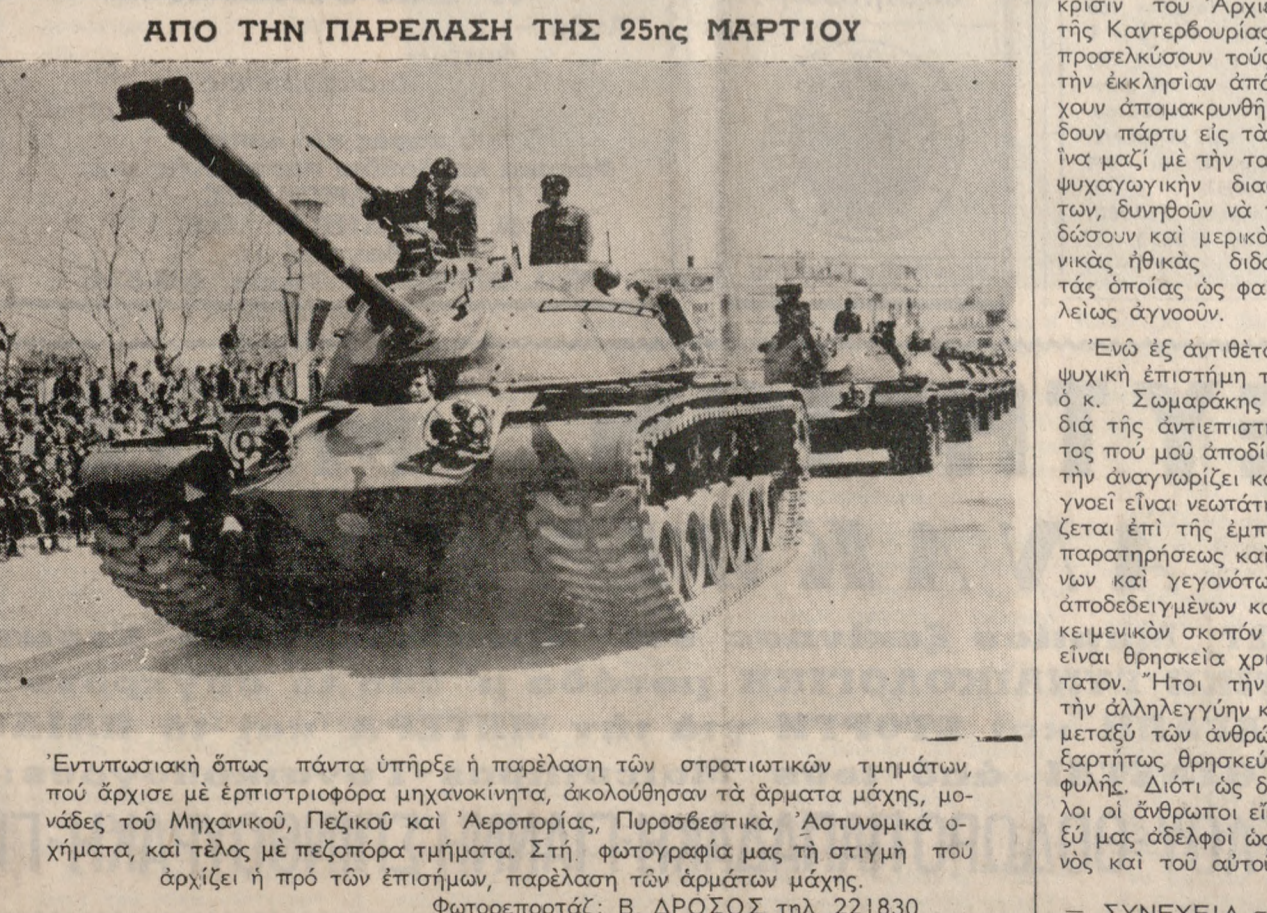
Εντυπωσιακή όπως πάντα ύπήρξε ή παρέλαση των στρατιωτικών τμημάτων, ποδ άρχισε με έπιστροφία μηχανοκίνητη, άκολούθησαν τά άρματα μάχη, μονάδες του Μηχανικού, Πεζικού και 'Αεροπορίας, Πυροσβεστικά, Άστυνομικά όχηματα, και τέλος με πεζοπόρα τμήματα. Στή φωτογράφιμα της στιγμής ποδ άρχίζει ή πρό των έπισημων, παρέλαση των άρμάτων μάχη.

Ίσως δεν θα έπρεπε να παρακολουθήσω τον κ. Σωμαράκη εις την άπαισιολογικήν ανύψωσιν της όποιου συνεχίζει, έφ' όσον, ούτε ήμωί είμαι θεολόγος, ούτε εκείνος φαίνεται διατεθειμένος να άποδεχθή, όσα οιαδήποτε πραγματικά πλήρη ή ποδεκτικά και αν το άναφέρω και άγνοή πλήρως την ιδίην μου ευεστίατη έπιστήμη, ούτε θέλει να την άναγνωρίσει ως τωιάτην. Έν τούτοις ήμωις χάρην των άναγνωστών ποδ παρακολουθούν από δεκαετίες τά άρθρα μου, από τού όσω την δούσαν άπάντησιν, αλλά διά τελευταίαν φοράν και έν συντομία, φειδόμενος της φιλοεπίσεως της έγκρίτου έφη μερίδος. Και πρώτα πρώτα ή θεολογική έπιστήμη ως γνωστόν με της όποιος τά επιχειρήματα προσπαθεί να μέ άντικρούση είναι παλαιά, άριθμεί διόν υπερδύδεκα και πλέον αιώνων, έχει άντικείμεν την ιστορία της Χριστιανικής θρησκείας και έκ κλησίας, ως και την έρευνά και έρμηνείαν των Γραφών. Άλλ' όμωις είναι έργον ανθρώπων περιλαμβάνόν τάς γνώμας και έρμηνείας των πατέρων της εκκλησίας υπό την έπίβουραν των τότε κρατούντων έλαχίστων έπιστημικών δεομένων, και δι' ένα