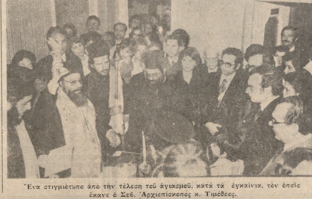
Ένα στιγμιότυπο από την τέλεση τού άγκινια, τόν όποιο έκανε ό Σεβ. 'Αρχιεπίσκοπος κ. Τιμέθεος.