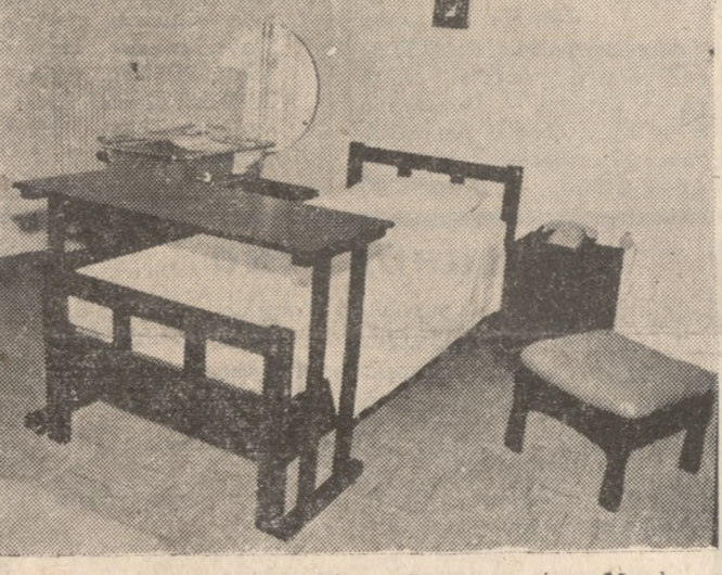
Τό έσωτερικό ενός δωματίου τού μαιευτήριου «Μητέρα»