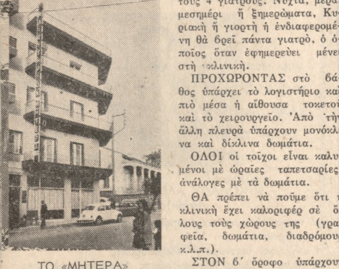
ΤΟ «ΜΗΤΕΡΑ» ΕΞΩΤΕΡΙΚΑ