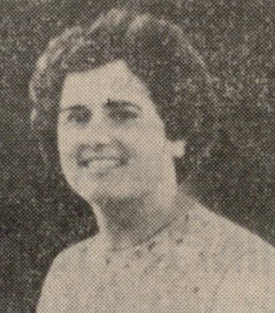
ΕΥΑΓΓΕΛΙΑΣ ΜΙΛΤ. ΧΑΙΡΕΤΗ

Την Κυριακή 16 'Απριλίου και ώρα 8.30 π.μ. τελούμεν εις τον Ι.Ν. 'Αγ. Μύρωνος της όμωνύμου κομποπόλεως, έτήσιον μνημόσυνον ύπέρ άναπαύσεως της ψυχής της άγαπημένης μας συζύγου, μητέρας, αδελφής και κόρης