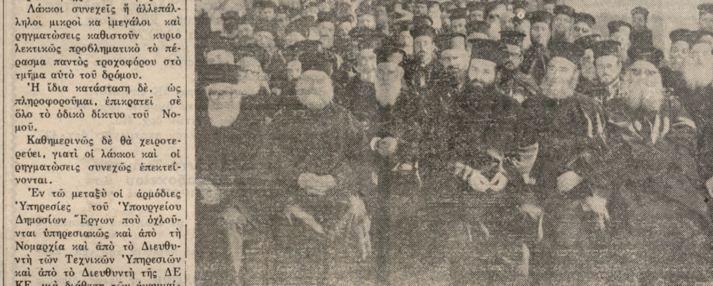
Φωτογραφικό στιγμιότυπο από την σύναξη των Ίερέων του Ηρακλείου και Έπαρχιών, που έγινε κατόπιν προκλήσεως του Σεβ. Αρχιεπισκόπου Κρήτης κ. Τιμωρέου, ό οποίος και τούς μίλησε.