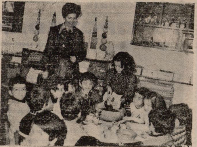
Στο 16ο Νηπιαγωγείο, νηπιαγωγός και νήπια, έκαναν χάρτες το καθιερωμένο ημερήσιο γεύμα τους, από όπου και η φωτογραφία μας. Επίσης τα παιδιά άνοιξαν τον κουμπάρ τους και τις 1500 δρχ. που υπήρχαν εκεί τις έφεραν στα γραφεία μας για λογαριασμό της ΣΤΣ της 'Αηλικών 'Ηρακλείου.