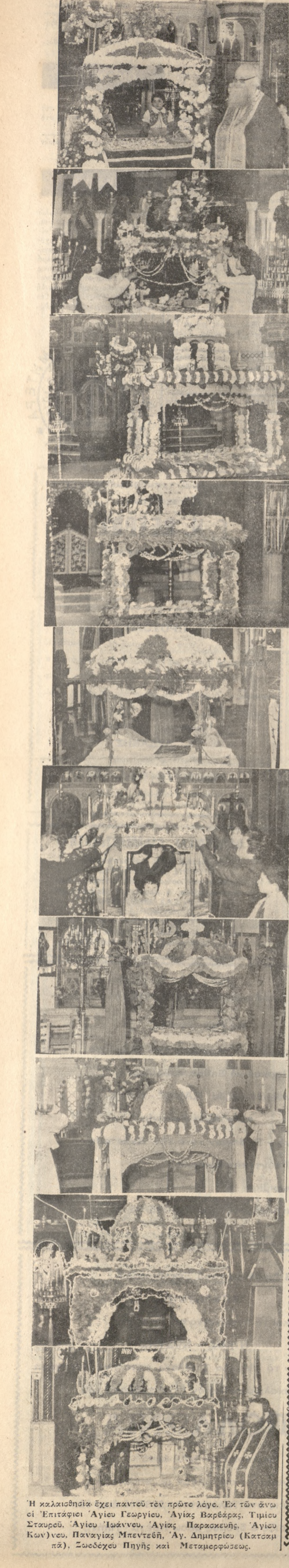
Η καλύτερη άρχη παντού τον πρώτο λόγο. Εκ των άνω οι Έπιτάφιοι Αγίου Γεωργίου, Αγίας Βαρβάρας, Τιμίου Σταυρού, Αγίου Ιωάννου, Αγίας Παρασκευής, Αγίου Κων/νου, Παναγίας Μπεντεβή, Άγ. Δημητρίου (Κατσαμπά), Σωδούχου Πηγής και Μεταμορφώσεως.