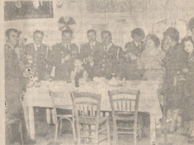
Στή Διοίκηση Χωροφυλακής 'Ηρακλείου τὸ Πάσχα γιορσάστηκε με τὸ πατροπαράδοτο γλέντι. Στή φωτογραφία μια ένα στιγμιότυπο.