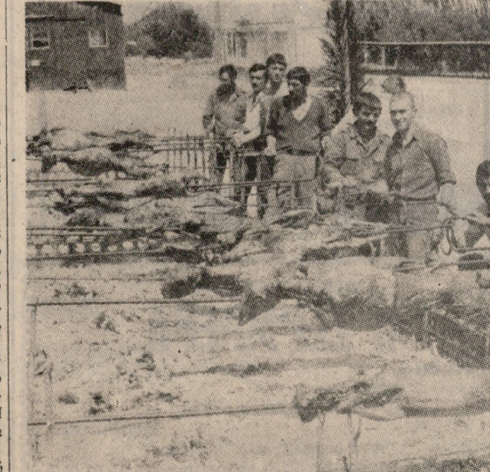
Ο πατροπαράδοτος όβελιας με τó άρνι τού Πάσχα, ψήφεται άπο τούς σημαντες της 126 Σ.Μ. Σε λίγο θ' άρχισι τó Πασχάλινω γλέντι, που άξιομαστικοι σημαντες και λαός θα γιορτάσουν ένα άξέχαστο Πάσχα.