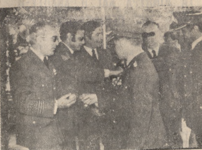
Στην 126 Σ.Μ. 'Αξιαστικού της Μονάδας τσσυγκρίζον τὸ Πασχαλινο άγιο.