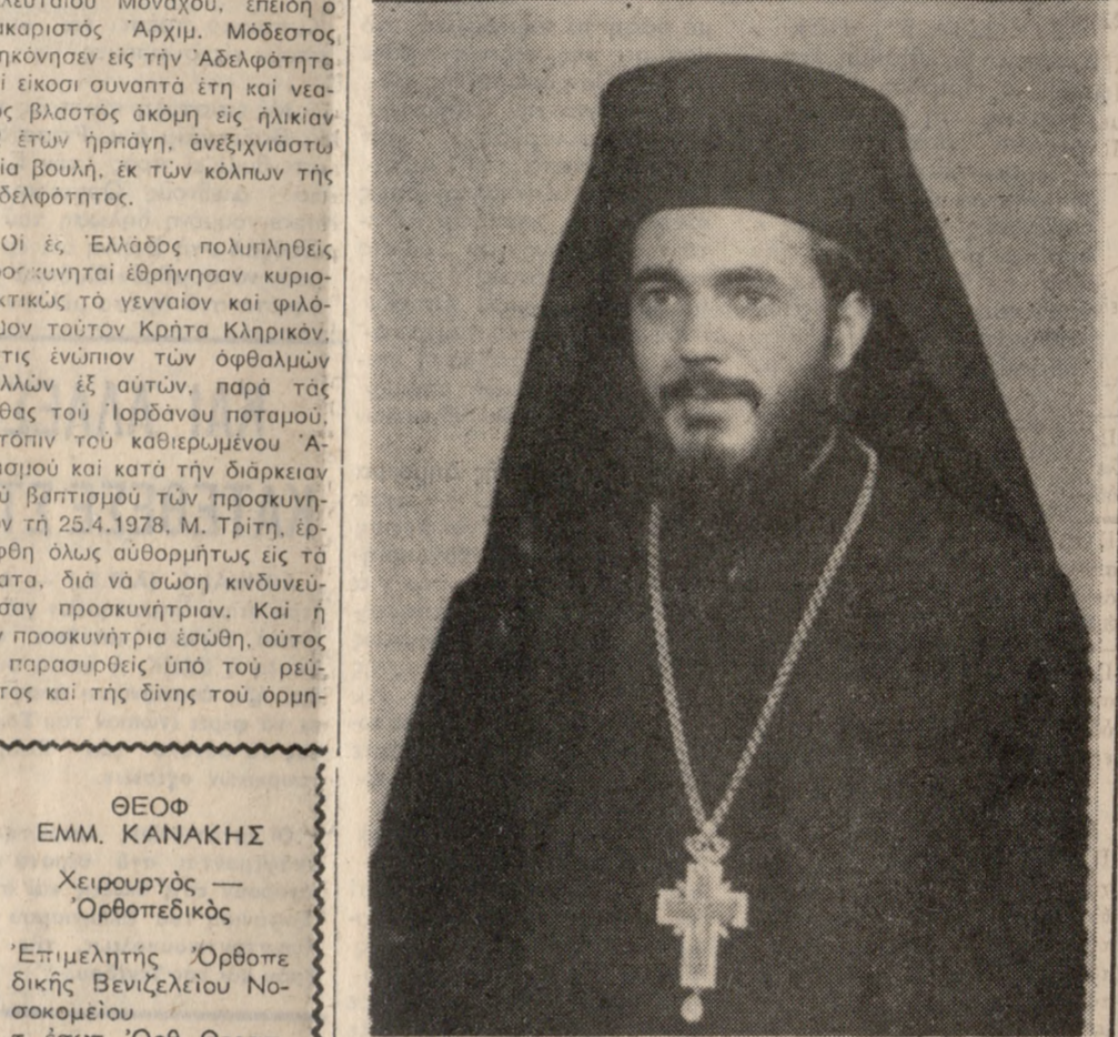
Ο Άγιοσταφίτης Άρχιμανδρίτης Μοδέστος

Τήν λαμπρότητα των εορτών του Πάσχα εις τά Ίεροσόλυμα έπεσκίσε ο αιφνίδιος και τραγικός θάνατος του ήρωικού Άγιοσταφίου Άρχιμανδρίτου Μοδέστου έξ Άγίου Μύρωνος Κρήτης. Η δούλη των Άγιοσταφίων Πατέρων είναι όπερίγραπτος από του Πατριάρχου μέχρι του τελευταίου Μοναχού, επειδή ο μακαριστός Άρχιμ. Μοδέστος διηκόνησε εις τήν Άδελφότητα επί εικοσι συναπτά έτη και νεατός βλαστός άκόμη εις ηλικίαν 32 ετών ήρπην, άνεξιχνίαστου θεία βουλή, εκ των κόπων της Άδελφότητας.