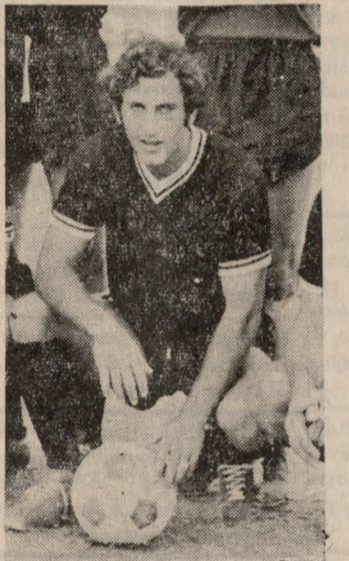
ΞΟΜΕΡΙΤΑΚΗΣ Καράος είναι να δοκιμαστέι

ΠΡΩΤΑΘΛΗΜΑ ΣΚΥΤΑΛΟΔΡΟΜΙΟΝ ΤΟ Σάββατο τό άπόγευμα διεξήχθη στό έθνικό γυμναστήριο τό πρωτάθλημα σκυταλοδρομιών άνδρών έφήβων και παίδων. ΕΓΙΝΑΝ σκυταλοδρομίες 4 X 100, 4 X 400, 4 X 800 και Σουηδική. ΣΤΗΝ βαθμολογία πρώτησε ο ΟΦΗ με 134 βαθμούς με δεύτερη την ΓΕΗ με 70 βαθμούς. ΕΣ άλλο αήριο θά γίνον οι διασυλλογικοί αγώνες γυμνασιών.