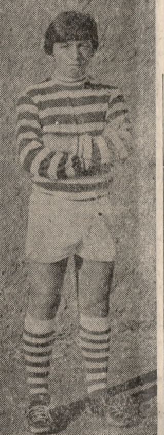
ΧΡΙΣΤΟΦΗΣ Σφάλμα ή αντίκατάστασή του

ΕΙΣΙΤΗΡΙΑ ΚΑΙ ΕΙΣΠΡΑΞΕΙΣ ΣΤΟΝ αγώνα ΟΦΗ — Καβάλας τά εισιτήρια ήταν 2338 και οι εισπραξίες 266.030 δρ. Έξ άλλοι στον αγώνα 'Ηρόδότου — Φωστήρα κτύπησαν 426 εισιτήρια και εισπραχθηκαν 30.710 δραχμές.