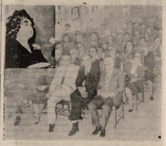
'Ενα στιγμιότυπο από τον έορτασμό της 'Ημέρας της Μητέρας στην κίεσσα της Βασιλικής του 'Αγίου Μάρκου.

ΜΕ πρωτοβουλία των γυναικείων οργανώσεων του 'Ηρακλείου έλαβαν χώρα προχθες διάφορες εκδηλώσεις στα πλαίσια του παγκοσμίου έορτασμού της 'Ημέρας της Μητέρας. ΤΗΝ 10η πρωινή ήψάλε δοξολογία στον ιερό ναό του 'Αγίου Τίτου, προσέξαγονος του Γενικού 'Αρχιερατικού 'Επιτρόπου της ΙΑΚ παπας 'Αρχιμανδρίτου κ. Νεστορίου. ΠΑΡΕΥΡΕΘΗΣΑΝ εκπρόσωποι των τοπικών 'Αρχών, τα προεδρεία των γυναικείων οργανώσεων και πολλές μητέρες. ΜΕΤΑ την δοξολογία ο Δή-