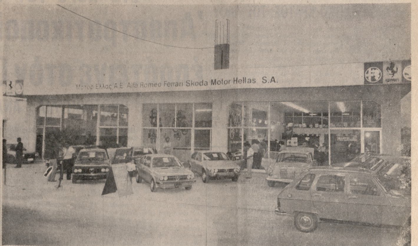
Γενική άποψη της έκθεσης της «ΜΟΤΟΡ ΕΛΛΑΣ» η οποία έχει την αντιπροσωπεία αυτοκινήτων της «ΑΑΦΑ ΡΟΜΕΟ», που προχθές έγιναν τα εγκαίνια του υποκαταστήματός της στην πόλη μας.