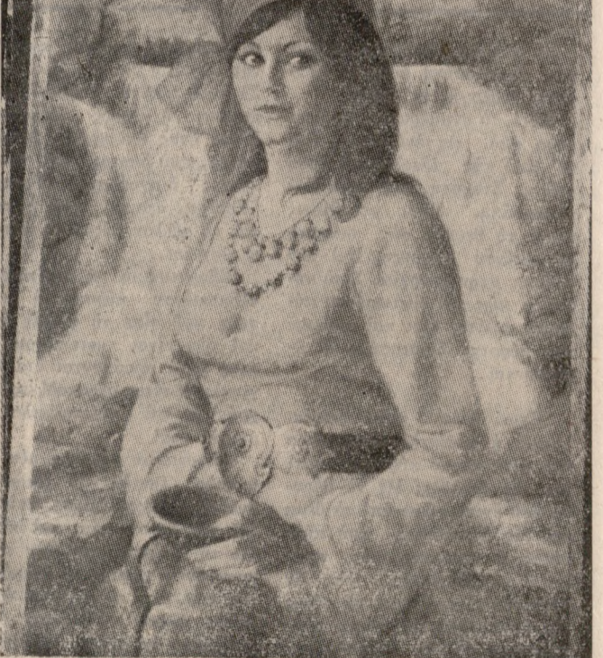
«ΜΑΚΕΔΟΝΙΚΗ ΟΜΟΡΦΙΑ» 'Η καινούργια δουλειά του ΜΠΟΤΗ ΘΑΛΑΣΣΙΝΟΥ.

'Από έφημερίδες του Σικάγου πληροφορούμεθα ότι ή έκει 'Εκθεση Ζωγραφικής του συμπατριώτη μας ζωγράφου ΜΠΟΤΗ ΘΑΛΑΣΣΙΝΟΥ σημείωσε έξαιρετική έπιτυχία. Οι κριτικοί έγραψαν κολακευτικά λόγια για την τελευταία του δουλειά, και έντυπωσιασε τό μεγάλο μέγεθος προτραίτο «Μακεδονική όμορφία» (6λ. κλισέ). Για τό προτραίτο αυτό προσφέρθη στο ΜΠΟΤΗ 25 χιλ. δολάρια, τό όποιο όμας έργο δέν πουλήθηκε γιατί άνήκει στη συλλογή του Καλλιτέχνη. 'Ο Θαλασσίνοδ έρχεται στην 'Ελλάδα άρχας 'Ιουνίου και θα έκθέσει έργα του στο Πειραιά, στις έκδηλώσεις «ΠΟΣΕΙΔΩΝΙΑ».