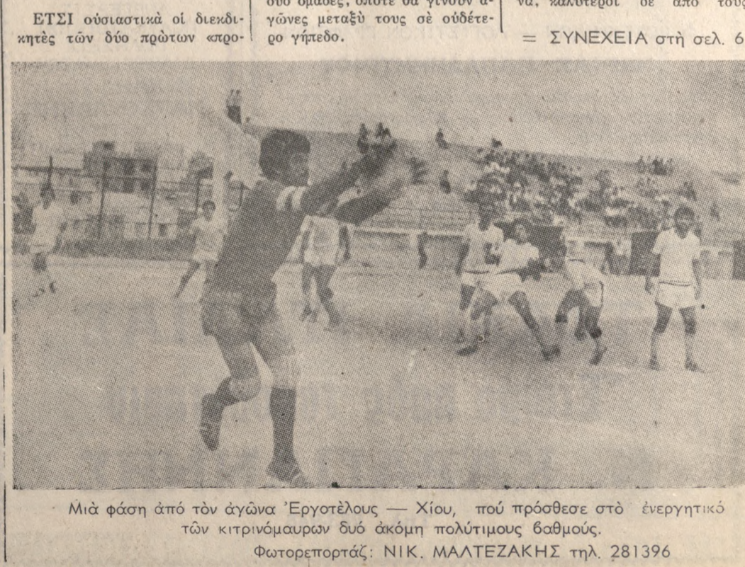
Μία φάση από τον αγώνα 'Εργοτέλους — Χίου, που πρόσθεσε στο ενεργητικό των κιτρινομάυρων δυο άκόμη πολύτιμους βαθμούς. Φωτορεπορτάζ: ΝΙΚ. ΜΑΛΤΕΖΑΚΗΣ τηλ. 281396

★ ΓΙΑ το πρωτάθλημα εφήβων ο ΟΦΗ κέρδισε προχθές την Παναχαϊκή με 2-0 ★ ΤΟ πρώτο δεκάμερο του προσχοφύς μήνος 'Ιουνίου θα διενεργηθούν άρχαιρεςίες στον Συνδεσμο 'Επισήμων Διακίτητων Ποδοσφαιρου 'Ηρακλείου, για την ανάδειξη Διοικήσεως. ★ ΤΗΝ Πέμπτη και ώρα 9η μ.μ. θα προβληθεί από την τηλεόραση «ζωντανός» ο αγώνας Δυτ. Γερμανίας — Πολωνίας για το Παγκόσμιο Κύπελλο. ★ ΤΗΝ Κυριακή ο 'Ηρόδοτος αγωνίζεται στην Πάτρα με την ομώνυμη τοπική ομάδα, για το πρωτάθλημα Β' Εθνικής. Στόν α' γύρο η ομάδα της 'Αλικαρνασσού είχε κερδίσει με 3-1.