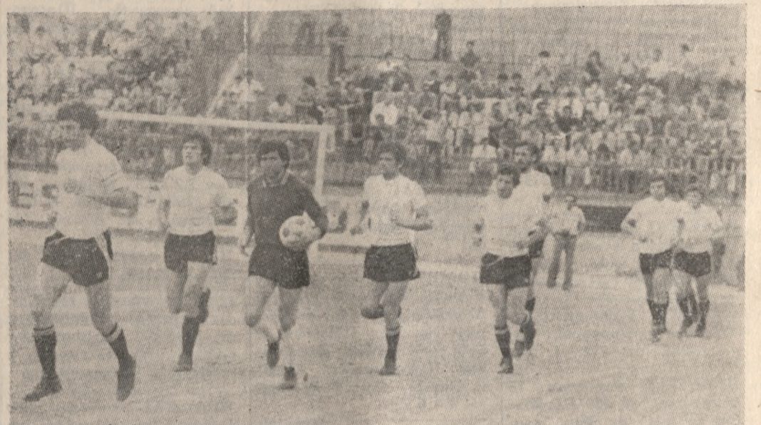
Οι παίκτες του ΟΦΗ μπαίνουν στον αγωνιστικό χώρο για τον τελευταίο αγώνα του πρωταθλήματος Α' Εθνικής, περιόδου 1977-1978.