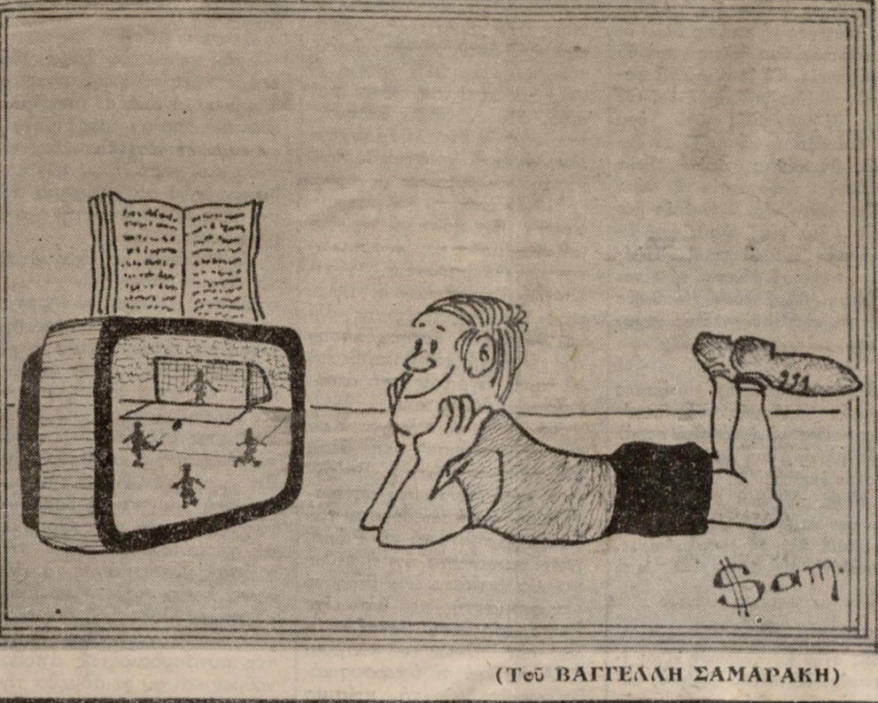
(Του ΒΑΓΓΕΛΛΗ ΣΑΜΑΡΑΚΗ)