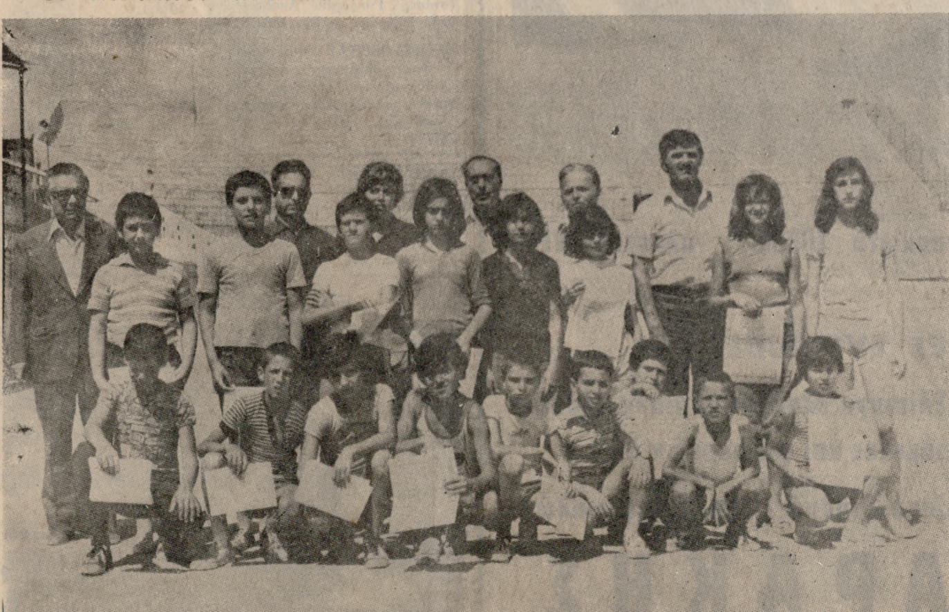
Οι μαθητές - άθλητές τού 4ου Δημοτικού Σχολείου - με τούς δασκάλους των - καμαρώνουν με τά διπλώματα πού πήραν γιατί πρώτευσαν στους έσωτερικούς αγώνες στίβου. Πού έξερε, μετά άπό λίγα χρόνια μερικά άπό τά παιδιά αυτά μπορεί να είναι πρωταθλητές στο άγωνισμά τους. Νομίζω ότι ο Διευθυντής καί οι Δάσκαλοι τού Σχολείου είναι άξιοι συγχαρητηρίων για τήν πρωτοβουλία τους αυτή, πού πρέπει να αποτελέσει παράδειγμα πρós μίμηση, ώστε ΟΛΑ τά Σχολεία να κάνουν έσωτερικούς αγώνες στίβου.

ΧΩΡΙΣ ούσιαστικά σφάλματα ή διαίτηρία τού κ. Ζαν τερίου.