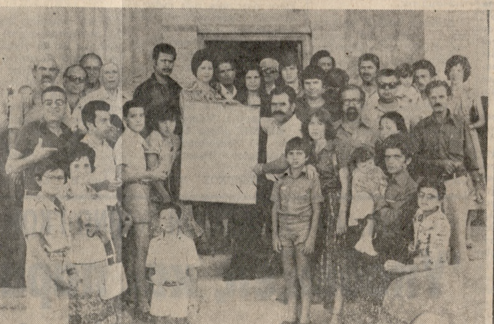
Προχθές έορτή τού 'Αγίου Πνεύματος οι φωτογράφοι τής πόλεώς μας είχαν τίν έπιση γιορτή τους. Τό πρωί παρακολούθησαν τήν Θ. Λειτουργία στόν ιερό ναό τού 'Αγίου 'Ιωάννου και στήν συνέχεια πήγαν τήν Εικόνα τού Σωμπετιού στήν οίκια τού συναδέλφου των κ. Σηφάκη.

* ΕΚΠΛΗΚΤΙΚΗ είναι ή φωτογραφία αυτή τού Βαί, που τράβηξε ό συνερ- γάτης τής στήλης ΒΑΣΙΛΗΣ ΔΡΟΣΟΣ (τηλ. 221830). Και σε πολλούς κατ' τέτοιες φωτογραφίες σου δημιουργού τήν έπιθυμία να έπισκεφθείς τό φονικόδασος. Είχα πολλά χρόνια να πάω στο Βαί. Πήγα προχθές και άπο- γοητευτικά. Είναι έγκαταλελειμένο στό έλεος... τών τουριστών! Τό φονικό- δασος έχει χωριστεί σε... υπαίθρια διαμερίσματα, στα όποια διαμένουν οι ξένοι του- ρίστες. Πού να πλησιάσει 'Ελληνας! Τόν δέχονται με άγριο μάτι. 'Η σφραγί- δα τής γροσουζιάς θρίσκειται παντού. 'Αντιλαμβάνεται κανείς ότι τό Βαί' άργά- θαινει! Τί κρίμα αλήθεια, ένα μπορούσε να γίνει ένα θέρετρο γι' αυτούς που τα δίνομα και όχι γι' αυτούς που τα παίρνουν. Γιατί οι τουρίστες που μένουν τώρα στό Βαί είναι από αυτούς που έρχονται στήν χώρα μας άπένταροι και προσπο- θούν να συντηρηθούν από έμάς. 'Αν υπάρχει κάποιος υπεύθυνος ως έμείς!