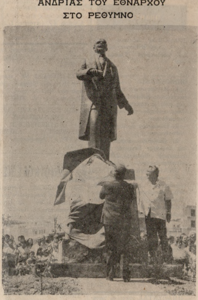
Τήν Κυριακή τό πρωί έγιναν στό Ρέθυμνο τά άποκαλυ- πτήρια του άνδριαντε του ΕΘΝΑΡΧΟΥ ΕΛΕΥΘΕΡΙΟΥ ΒΕΝΙΖΕΛΟΥ πρωτοεουλία του Δημάρχου κ. 'Εμ. Κα- λαϊτζάκη. 'Ο άνδριανς είναι προσφορά του Συλλόγου Ρεθυ- μνιωτών στην 'Αθήνα «ΑΡΚΑΔΗ» και τέν φιλοτέχνησε ό μακαρίτης Γλύπτης, Ρεθυμνιώτης Γιάννης Κανακάκης. Τά άποκαλυπτήρια έκανε ό ύπερωργς 'Εσωτερικών κ. Χρ. Στρατός και μίλισε ό Δημάρχος Ρεθυμνίας κ. 'Εμ. Κα- λαϊτζάκης.

● ΣΥΝΕΧΕΙΑ ΑΠ' ΤΗ ΣΕΛΙΔΑ 1 Γεωργίας έχει τον λόγον. ΣΤ. ΤΑΤΑΡΙΔΗΣ (Υφ. Γεωργίας). Κύριοι συνάδελ- φοι, ό άγαπητός κ. Ξυλόυρης αναφέρθηκε με μίς περιεκτική τού λόγου του για τά προ- βλήματα που αντιμετώπιζει ιδιαίτερα ό Νομός 'Ηρακλείου, σε σχέση με τό ευγενές προϊόν της όλιεας και τό έ- λαιολάδο. 'Όπως μάς έχει δοθεί ή εύκαιρία και παλαιό- τερα να συζητήσουμε αυτό τό θέμα στην Βουλή και να εκθέσουμε όλα εκείνα τά μέ- τρα τά όποια έχουν ληφθεί κατά καιρούς σχετικά με τό προϊόν αυτό, μοι δίδοται και σήμερα ή εύκαιρία να επανέ- λθω έπί τό θέμα και να έξασ- θω όσον προς τό ευγενές προϊόν όπως ούτως ή άλλως έδωλες πάς και με τους τρόπο αντιμετώπιζονται αυτό τό πρόβλημα. Είναι γνωστό σε πολλούς μας πως για την προστασία των γεωργικών προϊόντων λαμβάνεται πάντο τε δύο σειρά μέτρων άπό τά όποια πρωταρχικό είναι ό καθορισμός και ή έγκαιρη έξαγγελία των τιμών άσφα- λειας των βασικών σημασι- ακών έπιτεκτικών άποθη-