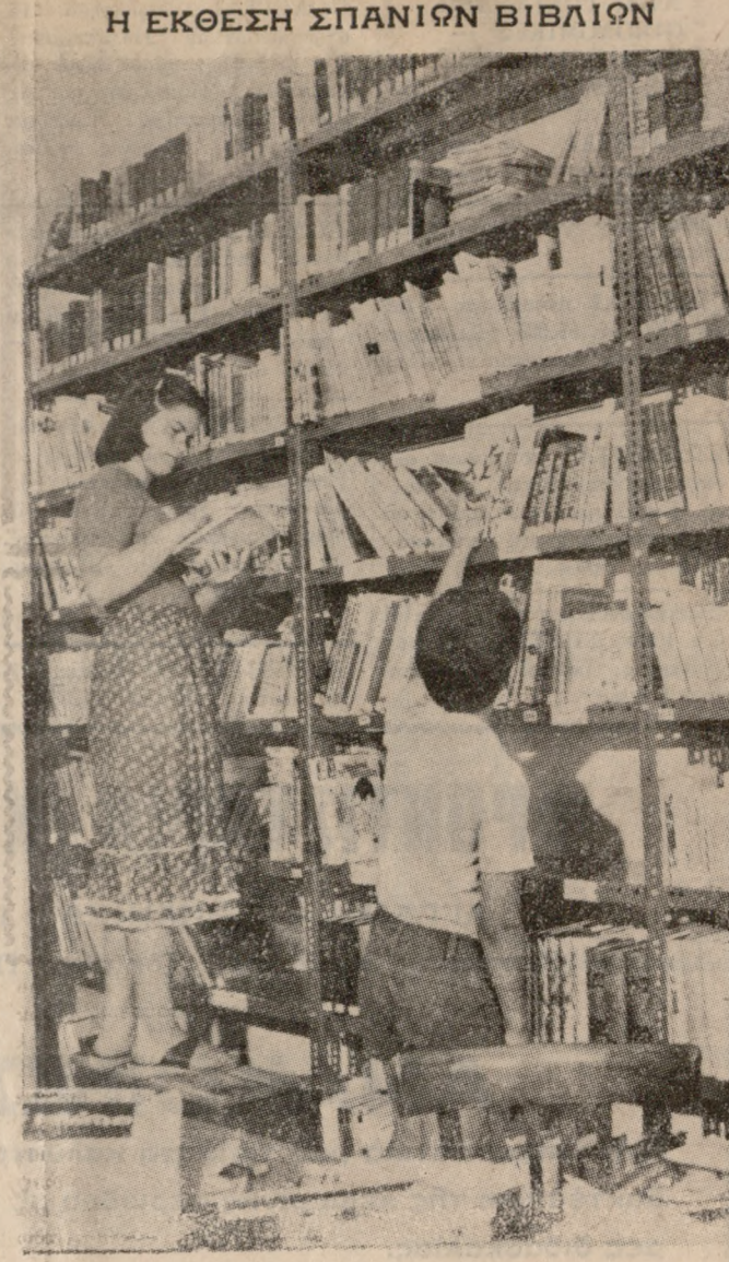
Αύριο θά γίνουν τα έγκυρια της εκδόσεως σπανίων έβελίων της Βικελιακής Δημοτικής Βιβλιοθήκης στην Βασιλική του Άγιου Μάρκου. Άνωτέρω έθελόδωκην έμεις άναζητά τέτοια έβελια στην Βικελία.

Τό Δ.Σ. του Συνδέσμου Διαιτητών Ποδόσφαιρου Ήρακλείου με άπόφασή του, ύπ' άριθ. 34)20-6-78 καλεί όλα τα μέλη του που έχουν δικαίωμα ψήφου εις ΕΤΗΣΙΑ ΤΑΚΤΙΚΗ ΓΕΝΙΚΗ ΣΥΝΕΛΕΥΣΗ εις τα γραφεία του Συνδέσμου Ραδαμάνθους 2 την 10 Ίουλίου 1978 ήμερα Δευτέρα. Μή γενομένης άπαρτίας θά γίνει την Τετάρτη 12 Ίουλίου 1978 την αύτη ώρα και στον αυτόν τόπο με θα ματα: 1) Έγκριση προόμολογισμού έτους 1978. 2) Έγκριση οικονομικής διαχειρίσεως περιόδου 1977—78 3) Λογοδοσία άπερχομένης Διοικήσεως 4) Άρχειρισές δι' έκλογή νέας διοικήσεως και έξελεγκτικής έπιτροπής. Ό Πρόεδρος ΕΥ. ΜΙΧΕΛΙΑΝΑΚΗΣ Ό Γεν. Γραμματέας Γ. ΚΟΥΚΟΥΛΑΚΗΣ Σημ.: Ύποψηφίοτες για τό νέο Δ.Σ. και την έξελεγκτική έπιτροπή γίνονται δεκτές μέχρι 7 Ίουλίου 1978. Έπίσης τις 7 Ίουλίου 78 παρακαλούνται τα μέλη να τακτοποιήσουν ταμειακάς για να έχουν δικαίωμα ψήφου.