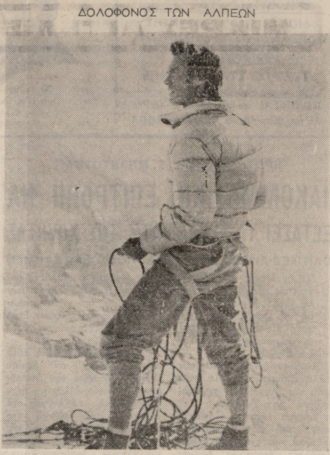
Μιά ταινία που θα σας καταπλήξη, με τό άγριο άνθρωπο-κυνηγητό στις χιονισμένες κορφές των 'Αλπεων. 'Αλπιτιστές - 'Ορειβάτες στο άγριο τοπίο των ψηλών βουνοκορφών θα σας χαρίση δύο ώρες άγωνίας και άνυπερβλητού θαύματος. Πρωταγωνιστής ό ΚΑΙΝΤ ΗΣΤΓΟΥΝΤ. 'Η ταινία προβάλεται στον Κιν'γράφο «ΗΡΟΔΟΤΟ».