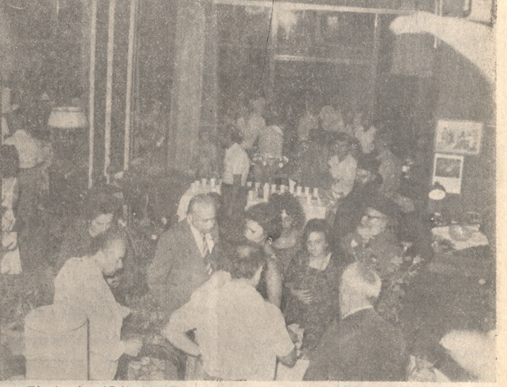
Την Δευτέρα 17 Ιουλίου έγινον τά εγκαίνια τής νέας έκθεσεως επίπλων...