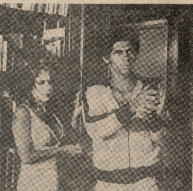
ΑΠΟ σήμερα προβάλλεται στον κιν/γράφο «ΚΑΣΤΡΟ» η υπέρροχη αστυνομική ταινία «Ο ΜΑΥΡΟΣ ΠΑΝΘΗΡ». Έκτός από το καλογραμμένο σενάριο στην ταινία παίζουν πολλοί καλοί ήθοιοι όπως οι Τζιμ Κέλλυ, Άλντο Ρεϋ, Τζόρτζ Λάτζεμπιτ, Μάρον Μπούς Λή κ.ά. Θα πρέπει να σημειωθεί ότι η ταινία προβάλλεται στο «ΚΑΣΤΡΟ» σε πανελλήνια πρώτη προβολή.