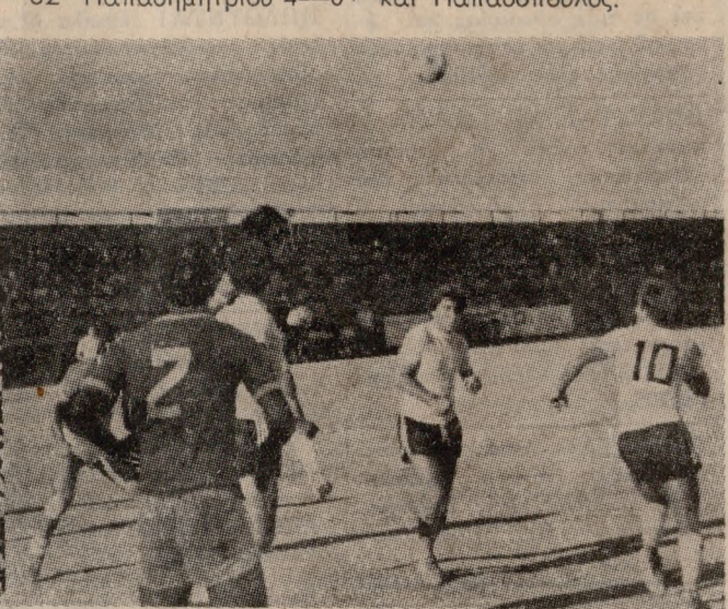
Μία φάση από τον άγώνα ΟΦΗ - Χανίων