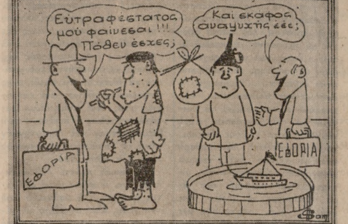
(ΤΟΥ ΒΑΓΓΕΛΗ ΣΑΜΑΡΑΚΗ)