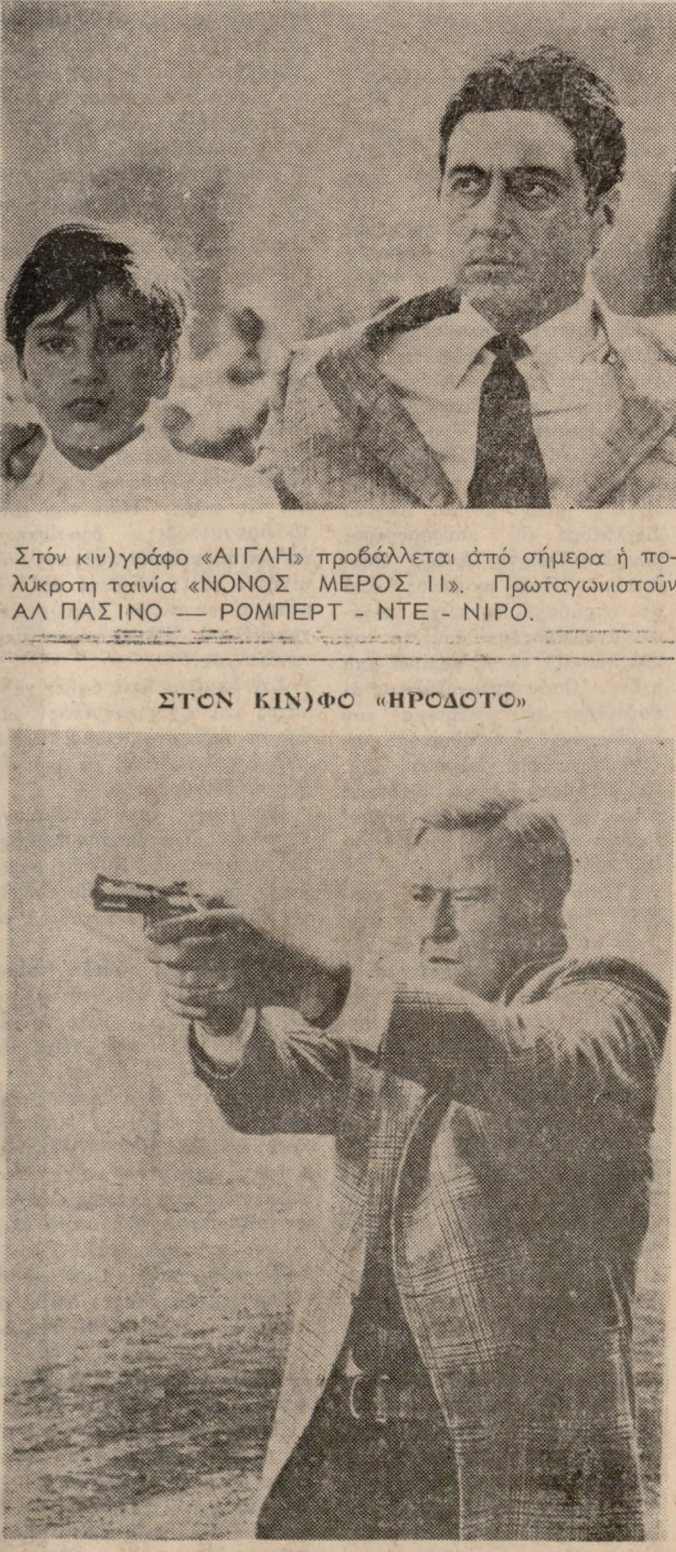
Αυτή είναι η ταινία που θα σας καταπλήξει με τόν άπείθανο καταπέτη της δράσεως και περιπέτειας ΤΖΩΝ ΓΟΥΑΙΗΝ ΡΙΤΣΑΡΝΤ ΑΤΤΕΝΜΠΟΡΚ και άλλοι στην ταινία «ΕΠΙΘΕΩΡΗΤΗΣ ΜΠΡΑΝΝΙΓΚΑΝ». Η ταινία που καθηλώνει και συναρπάζει και πού προβάλετε στον Κινοφω «ΗΡΟΔΟΤΟ».