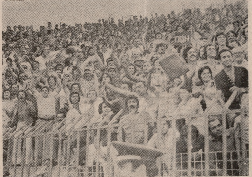
Ο άνυπερέλετος λαός του ΟΦΗ, που έκανε και πάλι μιά συγκλονιστική παρουσία τήν Κυριακή στην πρεμιέρα γιά τό Ήράκλειο του πρωταθλήματος Α' Έθνικής Κατηγορίας.

ΑΥΡΙΟ τό απόγευμα στις 5 ο Έργοτέλης θά δώσει φιλικό αγώνα στο γήπεδο του μέ τόν ΑΟΑΝ.