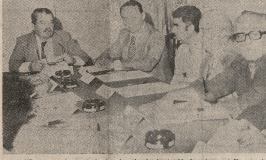
Ένα στιγμιότυπο από την σύσκεψη η οποία έλαβε χώρα στο Κεντρικό Λιμεναρχείο υπό την προεδρία του Υπουργού Έμπορικης Ναυτιλίας κ. Κεφαλογιάννη για το διαμετακομιστικό κέντρο.

ΟΠΩΣ τόνισε ο κ. Κεφαλογιάννης για το θέμα της διοικητικής οργάνωσης του λιμένος έδωσε εντολή στην επιτροπή να μην το εξετάσει δεδομένου ότι θα μελετηθεί και θα αντιμετωπισθεί επί Πανελληνίου βάσεως. ΤΕΛΟΣ ο κ. Υπουργός υπογράμμισε ότι η επιτροπή θα έκοπαι μελέτη η οποία θα αντιμετωπίζει το όλο θέμα σε βάθος και πλάτος του διαμετακομιστικού κέντρου, ενώ παράλληλα αποφασίστηκε, για τα δύο προσεχή χρόνια, όπως να αρχίσει η λειτουργία του, η εκτέλεση όρισμένων έργων. ΤΕΤΟΙΑ έργα είναι η ανέγερση εστεγασμένου χώρου της τάξεως των 50 εκατ. δραχμ. και η εξασφάλιση πιστώσεων για τον εξοπλισμό του λιμένος, με μία δαπάνη 90 εκατομμ. δραχμών. ΘΑ πρέπει να σημειώσουμε ότι όλες οι αποφάσεις της επιτροπής λάβθηκαν ομόφωνα και ότι προτεινόμενες λύσεις που είναι πρακτικά εφαρμόσιμες.